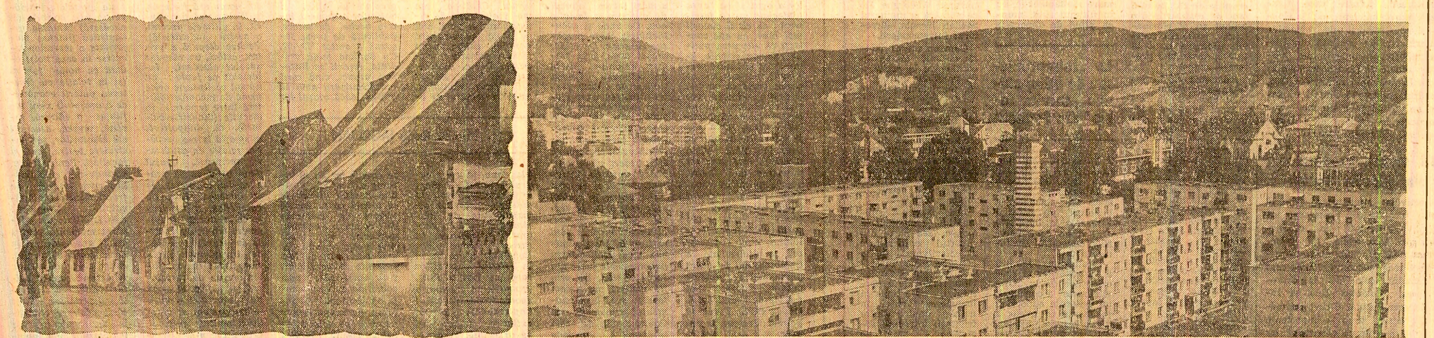
Doă imagini grăitoare: Bistrița de acum 15 ani și Bistrița de azi. Doă mărturii despre justețea politicii partidului de dezvoltare armonioasă a tuturor județelor patriei