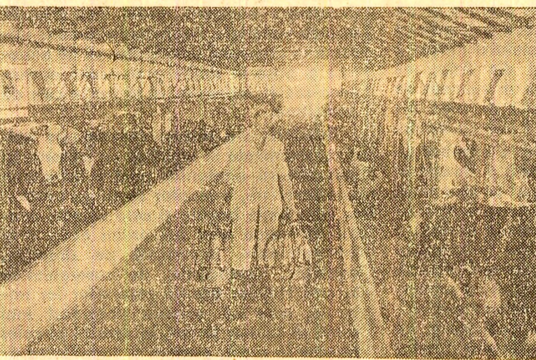
La ferma de vaci a I.A.S. Mogoșoaia