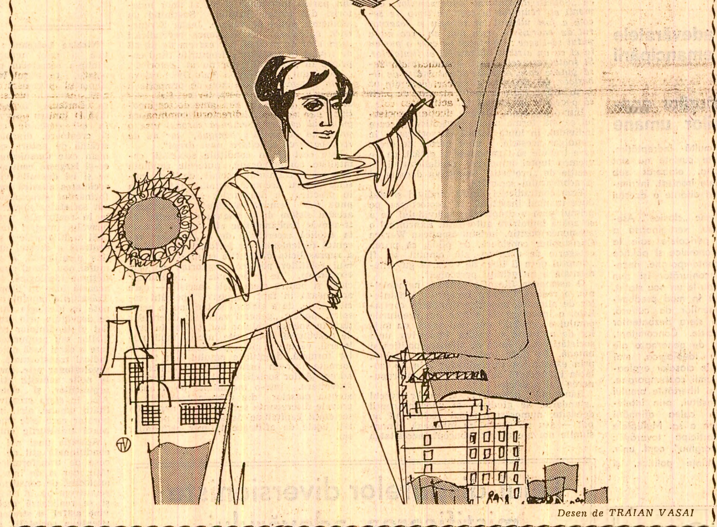
Desen de TRAIAN VASAI