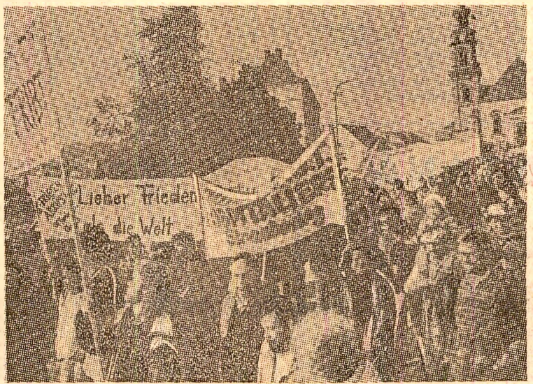
În orașul Bitche, din Franța, a avut loc, recent, o demonstrație de protest împotriva instalării de noi rachete nucleare americane cu rază medie de acțiune pe continent. Printre manifestanți s-au aflat și luptători pentru pace din R.F.G.

TOKIO 24 (Agerpres). — În orașul japonez Koba a avut loc un mare miting al reprezentanților opiniei publice împotriva cursei înarmărilor, pentru dezarmare și pace. După cum relatează ziarul „Akahata“, vorbitorii la miting au subliniat necesitatea reducerii cheltuielilor militare ale Japoniei și acțiunii manifestărilor opiniei publice în favoarea adoptării unor măsuri practice de dezarmare, în primul rând de dezarmare nucleară.