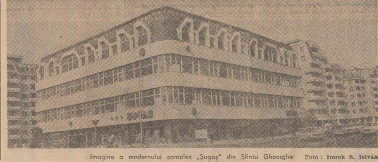
Imagine a modernului complex „Sugoș” din Sfintu Gheorghe.

Administrația de Stat Loto-Pronosport organizează duminică 16 ianuarie 1983 prima tragere Loto 2 din noul an — prilej de noi și mai succesive, dar și de mai simplu și deosebit de avantajos. Se reaminteste că un bilet costă numai 10 lei și poate fi completat cu o variantă achitată suta la sută sau cu patru variante achitate în cotă și 25 la sută. În interent, cota jucată, fiecare bilet are drept de participare la toate cele trei extrageri a cite patru numere, însumind 12 numere din totalul de 75. Cistigul maxim pe o variantă este un autoturism „Lancia 1300” și cel minim de 100 lei (pentru variantele cu numai două numere dintr-o extrageră). Simbătă 15 ianuarie este ultima zi de procurare a biletelor.