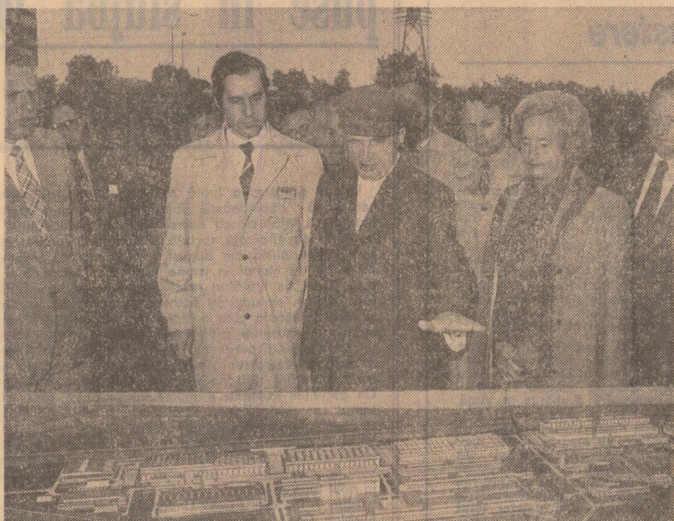
24 septembrie 1982. În timpul vizitei de lucru la Combinatul de utilaj greu din Iași

VIZITELE DE LUCRU ALE SECRETARULUI GENERAL AL PARTIDULUI, AMPE DESCHIDERI SPRE VIITORUL ȚĂRII