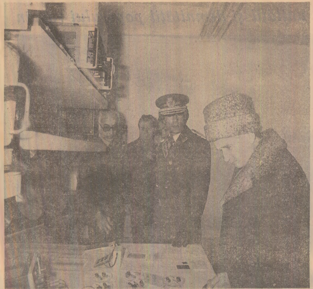
În timpul vizitei la Centrul Național de fizică, de pe platforma Măgurele