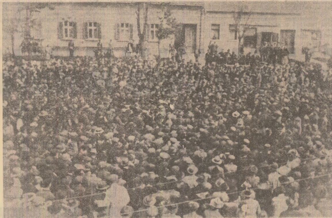
RESIȚA 1931. Imagine semnificativă din anii marii crize economice interbelice: mil și mil de oameni demonstrând împotriva asupririi și exploatații capitaliste, o amestecul monopolurilor străine în treburile țării, pentru drepturi și libertăți economice și politice — mărturie a continuității și ridicării pe o treaptă nouă, superioară a luptelor proletare, a puternicei afirmări a clasei noastre muncitoare, sub conducerea partidului comunist, în viața social-politică românească.