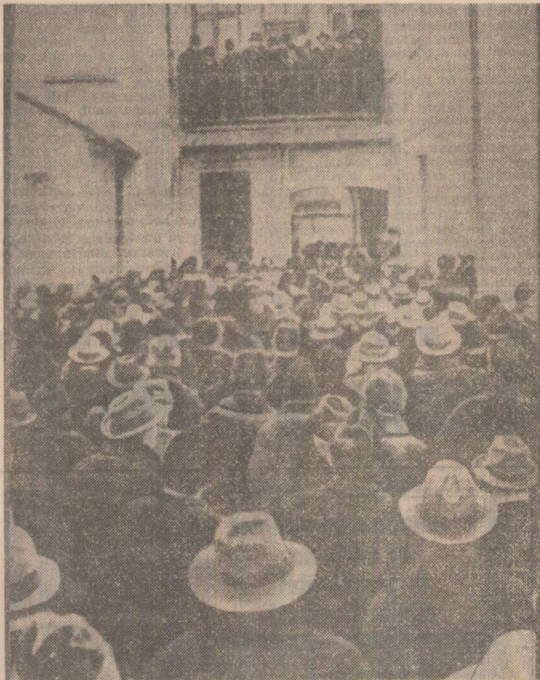
Una dintre numeroasele întruniri ale muncitorimii CAPITALEI, desfășurată în ianuarie-februarie 1933. În cadrul acestor ample acțiuni revoluționare s-a dat glas cu putere protestului muncitoresc împotriva asupririi sociale, împotriva acaparării bogățiilor țării de către monopolurile străine, hotărâri lor de a apăra și lărgi drepturile democratice, de a se opune fascismului și războiului, de a apăra independența și integritatea țării. Erau idealurile ce intruneau largă adevătură a muncitorimii din întreaga țară, a tuturor oamenilor muncii.

Increderi acordate, clasa noastră muncitoare i-a răspuns și răspunde cu vibrante fapte de eroism, de muncă harnică și tenace, cu implacabilă mereu mai profundă în opera de făurire a noii orinduirii, cu exemplară altitudine față de muncă, față de avuția națională. Iar prin toate acestea dobîndesc o nouă strălucire bogatele sale tradiții revoluționare, în rindul cărora marile acțiuni muncitorești de acum cinci decenii se înscriseră ca o luminoasă și eroică pagină.