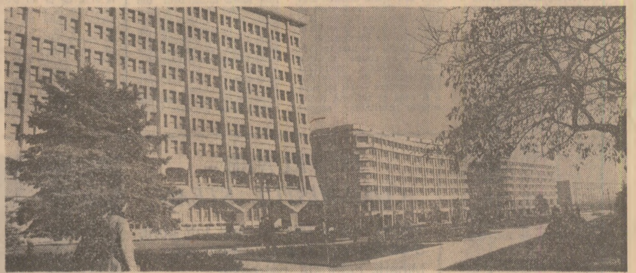
Modernul centru civic al unuia dintre orașele înfloritoare ale țării — municipiul Ploiești

1933 50 DE ANI 1983 de la eroicele lupte revoluționare din 1933 ale muncitorimii române