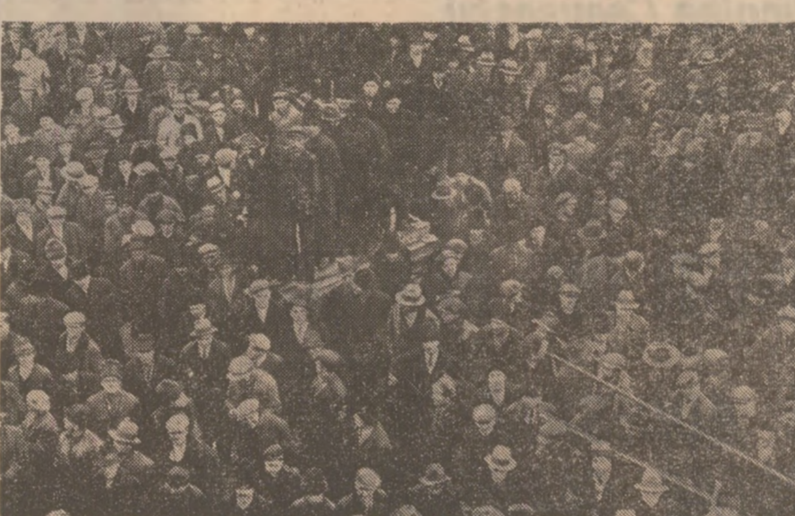
Muncitori in curtea Atelierele C.F.R. „Grivita”, 15 februarie 1933