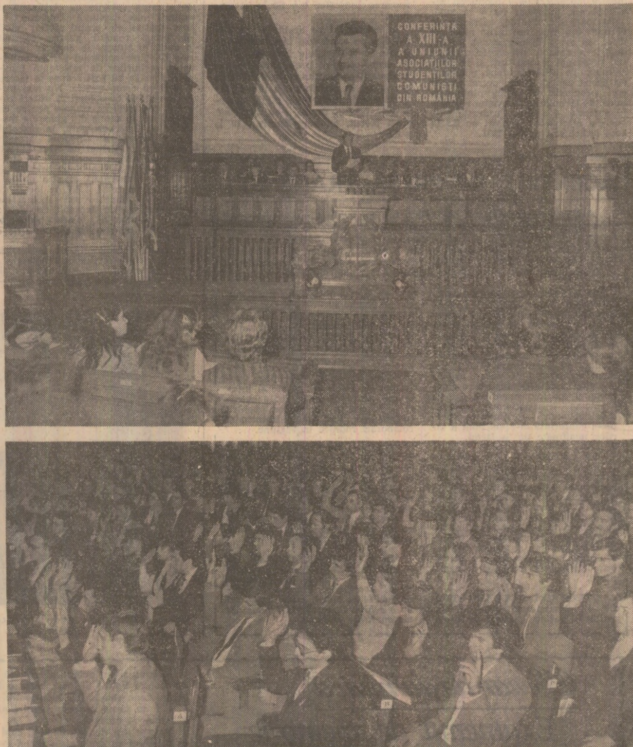
CONFERINȚA A XIII-A A UNIUNII ASOCIAȚIILOR STUDENȚILOR COMUNIȘTI DIN ROMÂNIA

Vă rugăm, mult iubite și stimate tovarășe Nicolae Ceaușescu, să primiți asigurarea hotărîrii neestrămuate a tinerei generații universitare a României socialiste de a munci, de a învăța și de a se pregăti la nivelul exigențelor revoluției științifico-tehnice contemporane, al dinamismului fără precedent al economiei, științei și culturii românești, de a face totul pentru a fi la înălțimea cerințelor maiore ale epocii ce se identifică, în conștiința tuturor fiilor națiunii noastre socialiste, cu împunătoarele dumneavoastră personalități. În epoca Ceaușescu — epocă fără egal în istoria multimilenară a țării, care a înscris cu fermă literă națiunea noastră pe calea dezvoltării multilaterale, a fauririi socialismului și comunismului pe pămîntul strămoșesc al scumpei noastre patrii, Republicii Socialiste România.