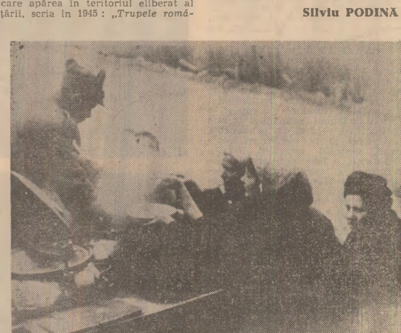
Ostași români distribuind hrană caldă populației budapestane, în timpul luptelor pentru eliberarea Budapestei

Progrese notabile s-au înregistrat în domeniul relațiilor economice, au avut loc creșteri constante ale schimburilor comerciale, ponderea mașinilor și utilajelor depășind în prezent jumătate din volumul livrărilor reciproce. Totodată, s-a dezvoltat colaborarea pe planul științei și tehnicii, al artei și culturii, s-au lărgit schimburile reciproce de experiență în scopul unei mai bune cunoașteri și mai mari apropieri între cele două popoare. Desigur, dezvoltarea pe mai departe în acest spirit a relațiilor de prietenie și cooperare româno-ungare în diferite domenii de activitate poate fi deșirată în folosul celor două țări și popoare, al cărei general a socialismului și păcii. ...Acesta sînt gândurile și sentimentele pe care le încercăm cel care vizitează orașul unde acum aproape patru decenii în înlestarea acrișă cu trupele fasciste ațîța ostași români și-au jertfit viața.