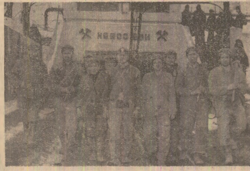
La mina Ral, din bazinul carbonifer Comănești, minerii les din schimbul de lucru cu satisfacția de a fi extras în plus 10 tone de cărbune