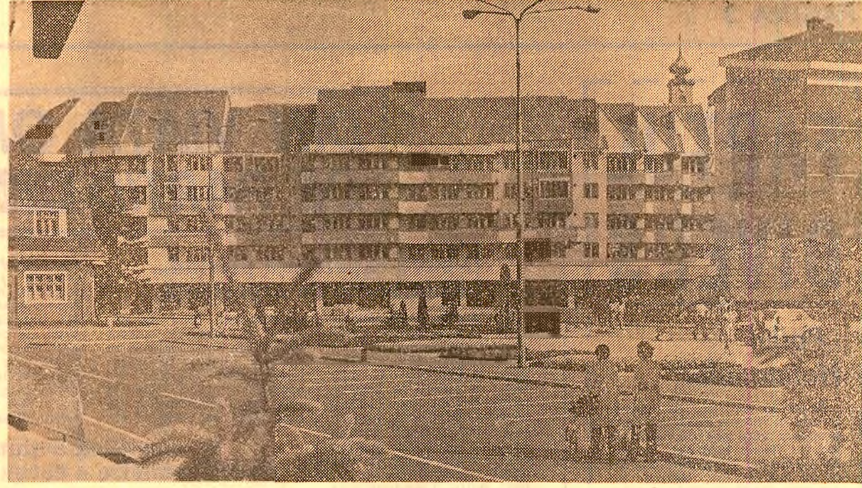
Bistrița — 1983, un oraș modern

fixă, sînt așa-zise modernisme sau poeme în proză. Asta nu mai este poezie”. Exagera, desigur, dar cu un asemenea cult de bună credință, pasiune de poezia marilor clasici, se poate discuta în limitele bunului gust, cu argumente convingătoare. Am discutat mult atunci. Despre forma „fixă” și cea „liberă”, adică poemele în proză. Despre tamb și dactil, despre rimă încrucișată și rimă împerecheată etc. etc., despre care, deși le fotosea,