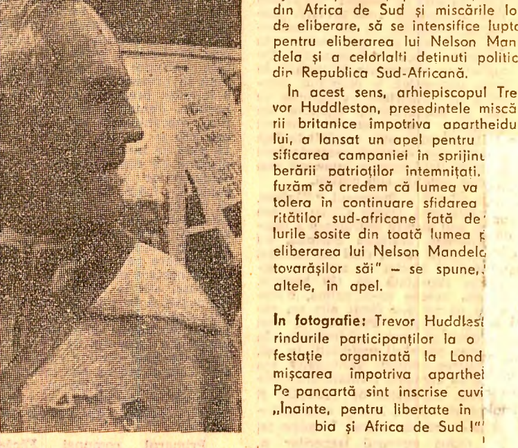
În fotografie: Trevor Huddleston, unul dintre liderii mișcării împotriva apartheidului, care a lansat un apel pentru sificarea campaniei în sprijinul berării patrioților întemnițați.

Pentru prilejul Zilei internaționale pentru eliminarea discriminării rasiale, Comitetul special al O.N.U. împotriva apartheidului și Mișcarea împotriva apartheidului din Marea Britanie au dat publicității o declarație purtând semnăturile a peste 4 000 de personalități — conducători de partide politice, de sindicate și de organizații religioase, membri ai parlamentelor și alte figuri proeminente ale opiniei publice din toate țările — în care cheamă guvernele și organizațiile neguvernamentale să sprijine și să promoveze acțiuni internaționale efective pentru lichidarea apartheidului din Africa de Sud. Documentul cere să fie sprijinit ajutorul pentru popoarele oprimite din Africa de Sud și mișcările lor de eliberare, să se intensifice lupta pentru eliberarea lui Nelson Mandela și a celorlalți deținuți politici din Republica Sud-Africană.