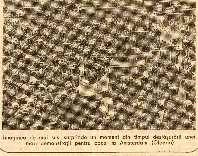
Imaginea de mai sus surprinde un moment din timpul desfășurării unei mari demonstrații pentru pace la Amsterdam (Olanda)

La Stockholm a avut loc seminarul „Europa, arma nucleară și șomajul”. Participanții și-au exprimat îngrijorarea față de continuarea cursei înarmărilor, subliniind că în prezent pentru scopuri militare se cheltuiesc fonduri materiale uriașe, rămânând, în același timp, nerăzolvate probleme sociale grave în multe țări ale lumii. Primul ministru al Suediei, Olof Palme, s-a pronunțat pentru reluarea politicilor de desistare și pentru crearea unei zone denuclearizate în nordul Europei.