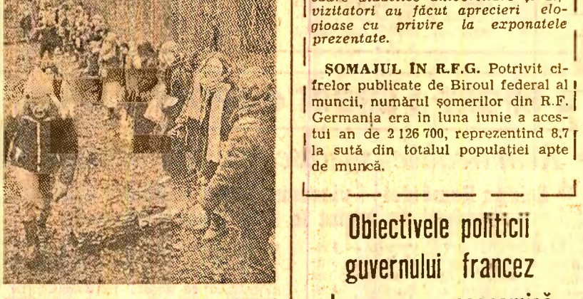
In jurul bazei de la Greenham Common, unde urmează o fi instalate noile rachete de croazieră americane, militanțele pentru pace au format un lanț viu în lungime de peste 12 kilometri, un adevarat baraj uman împotriva primeiidei morții atomice.