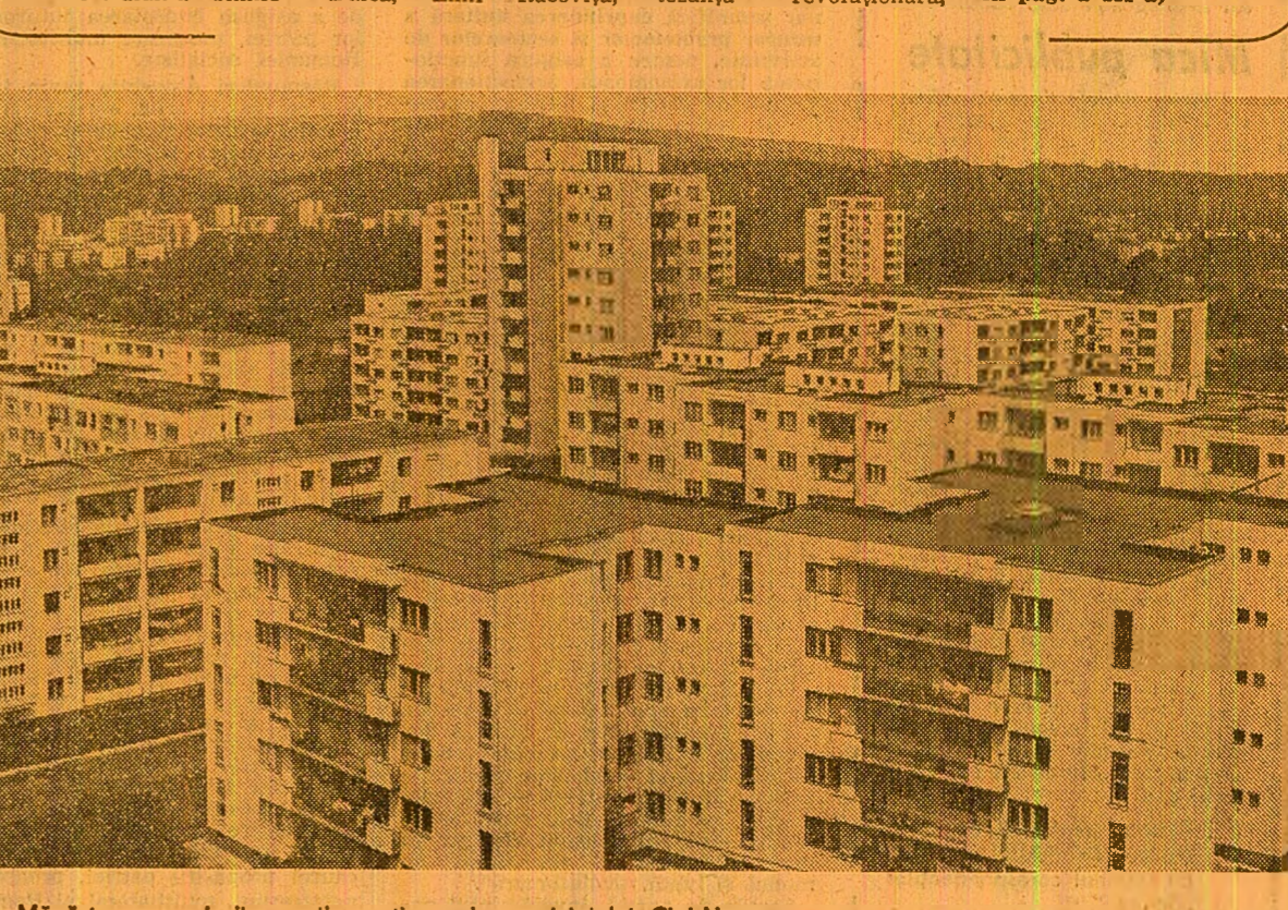
Măniștur — unul din marile cartiere ale municipiului Cluj-Napoca

Pentru cine vine astăzi la Cluj-Napoca reperele topografice sînt multiple. Dezvoltarea impetuoasă a municipiului contemporan a adăugat noi valori patrimoniului său construit. Și cînd spunem aceasta ne gîndim în primul rînd la maiestuosul cartier de locuințe Măniștur. Aici, cînd actualul cincinal se va încheia, vor locui, în 24 de mii de apartamente, peste o sută de mii de oameni, echivalentul demografic clujean al anului 1938. De pe promontoriul Cetățului se pot recunoaște cu ușurință orașului și Almai Mater, Institutul Agronomic și farmele sale în care studenții învață știința pămîntului, Centrul teritorial de calcul electronic sau întreprinderea de produse electronice. Și diagrama reținei va mai reține, de sigur fără pretenții de ierarhizare valorică, Gră-