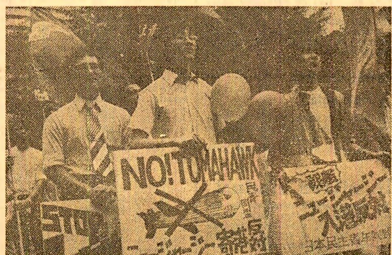
Demonstrație împotriva armelor nucleare la Tokio

BONN 7 (Agerpres). - La Stuttgart, Karlsruhe și în alte orașe ale R.F.G. s-au desfășurat simbolic mitinguri și demonstrații împotriva pericolului unei catastrofe nucleare la care au luat parte militanți pentru pace, reprezentanți ai unor partide politice, organizații sindicale, de tineret și de femei. Manifestațiile au fost organizate în legătură cu împlinirea a 38 de ani de la lansarea bombei atomice asupra orașelor japoneze Hiroshima și Nagasaki.