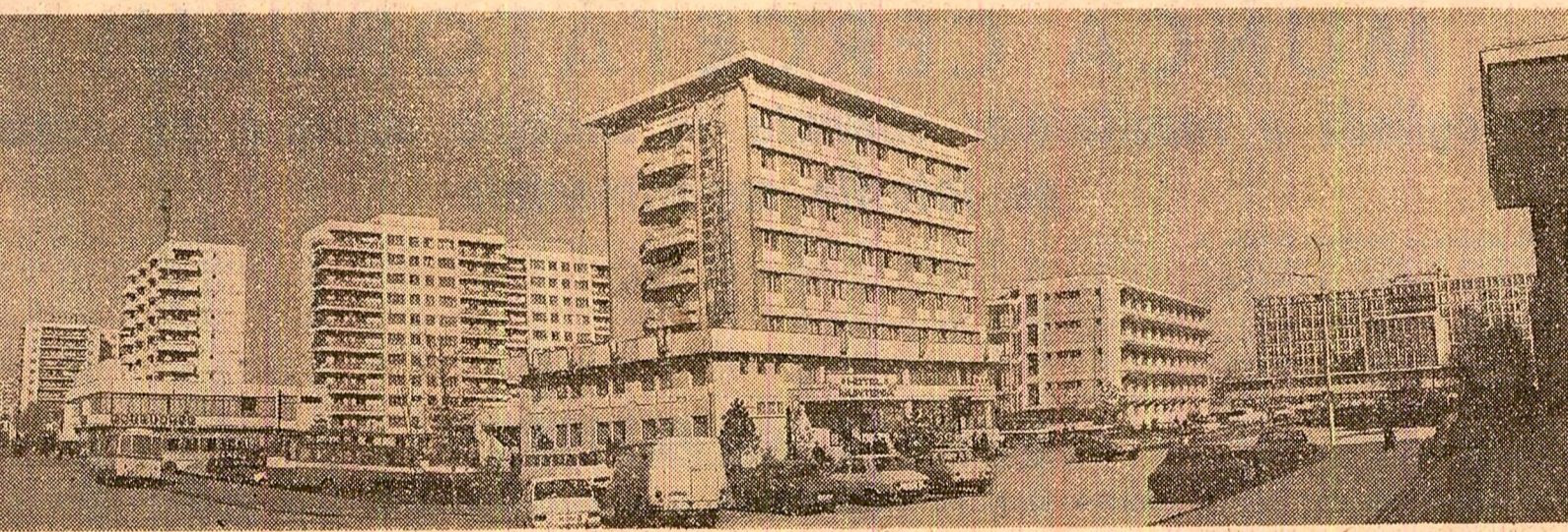
Noile dimensiuni urbanistice ale Sloboziei de azi

Pentru a se asigura aprovizionarea ritmică a piețelor cu legume proaspete și a fabricilor de conserve cu materii prime, organele de specialitate au stabilit grafice de recoltare și livrare a legumelor pe zile și săptămîni. La întocmirea lor s-au avut în vedere atât producția obținută în grădini, cit și cerințele de consum ale populației. Printre temerice organizare a muncii la cules și transport, aceste grafice trebuie respectate exemplar.