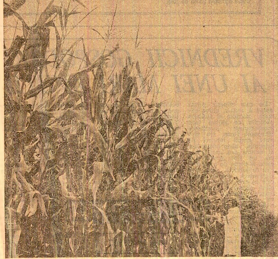
Ingrășăminte atîtea cîte sînt necesare, irigații, o densitate optimă — iată secretul celor 20 000 kg porumb la hectar cîte se obțin din acest lan

Pageină realizată de Ioan HERTEG