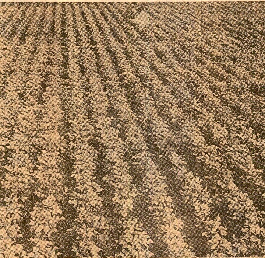
Fasolea cultivată în luna iunie, după orz, produce 1 200—1 500 kg boabe la hectar și îmbogățește, totodată, solul cu 50 kg de azot

Țara noastră dispune de aproape 2,5 milioane de hectare irigate, iar potrivit Programului național pentru asigurarea unor producții agricole sigure și stabile, la sfîrșitul anului 1983 sistemele de irigații vor cuprinde 5,3 milioane hectare, adică în treaga suprafață irigabilă a țării. Or, această imensă suprafață, pentru amenajarea căreia statul a cheltuit și va cheltui în continuare multe miliarde de lei, trebuie să rodească mai mult. Simpla udare a culturilor nu a fost și nu este suficientă. Esențial este să se obțină la fiecare hectar o producție maximă, la nivelul posibilităților oferite de extinderea mecanizării, chimizării și irigațiilor, iar pe aceeași suprafață să fie realizate două și chiar mai multe culturi. La Fundulea s-a făcut în acest sens o adevărată cotitură. Cercetătorii și-au îndreptat mai mult atenția spre marea producție. Ei au experimentat cele mai potrivite tehnologii, care să aibă aplicabilitate imediată în practică, au cautat și au găsit modalități de îndrumare și sprijinire efectivă a unităților agricole. În activitatea lor de producție, contribuind prin promovarea noului în știință și tehnologie la obținerea de rezultate mereu mai bune. Să exemplificăm.