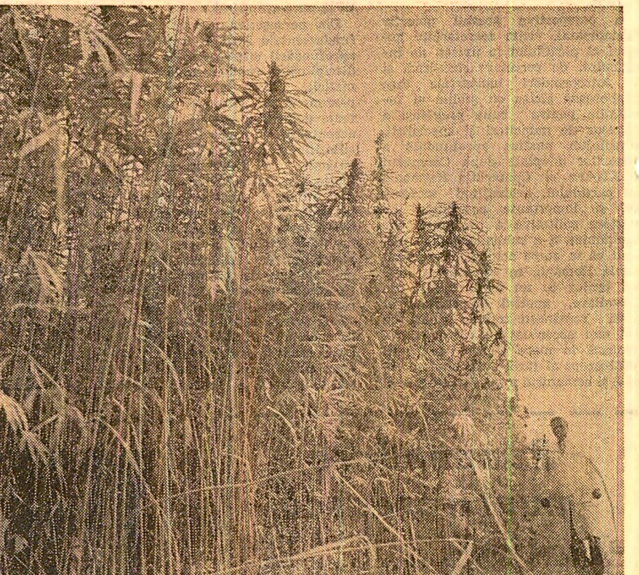
Din această cînepă în cultură succesivă, care depășește cu mult înălțimea unui om, se obțin 12 000 kg tulpini la hectar, cu o fibră de bună calitate

În spiritul indicațiilor date de tovarășul Nicolae Ceaușescu la recenta plenară a Consiliului Național al Agriculturii, organelor și organizațiilor de partid, direcțiile agricole județene au dator să întreprindă largi acțiuni pentru cunoașterea și extinderea „experimentului Fundulea” în ce privește culturile succesive și asigurarea unor densități superioare de plante la hectar, astfel încît prin aplicarea în practică a rezultatelor cercetărilor și experiențelor acumulate aici să se obțină o creștere generală a producției agricole.