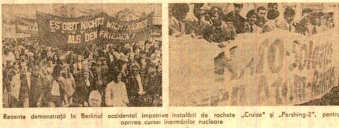
Recente demonstrații în Berlinul occidental împotriva instalării de rachete „Cruise” și „Pershing-2”, pentru oprirea cursei inarmărilor nucleare

POPULAȚIA THAILANDEI era la sfîrșitul lunii iunie de 49,2 milioane persoane. La Bangkok, capitala țării, trăiesc 5,5 milioane de locuitori.