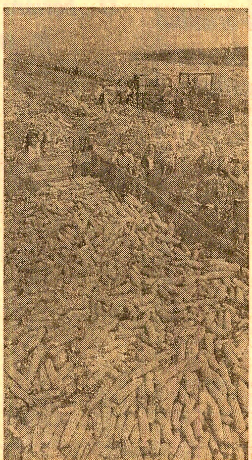
În alte județe înșă, chiar din zona latii agricole — Constanța, Giurgiu și Arad — unde porumbul a ajuns la maturitate, culesul nu se desfașoară în timp corespunzător.

Județe în care porumbul a fost strîns de pe întinse suprafețe. Astfel, în cooperativele agricole din județul Olț porumbul a fost recoltat de pe 91 la sută din suprafețe, Neamț — 89 în sută, Botoșani și Iași — 88 la sută, Mehedinți — 81 la sută, iar în sectorul agricol Ilfov — 85 la sută.