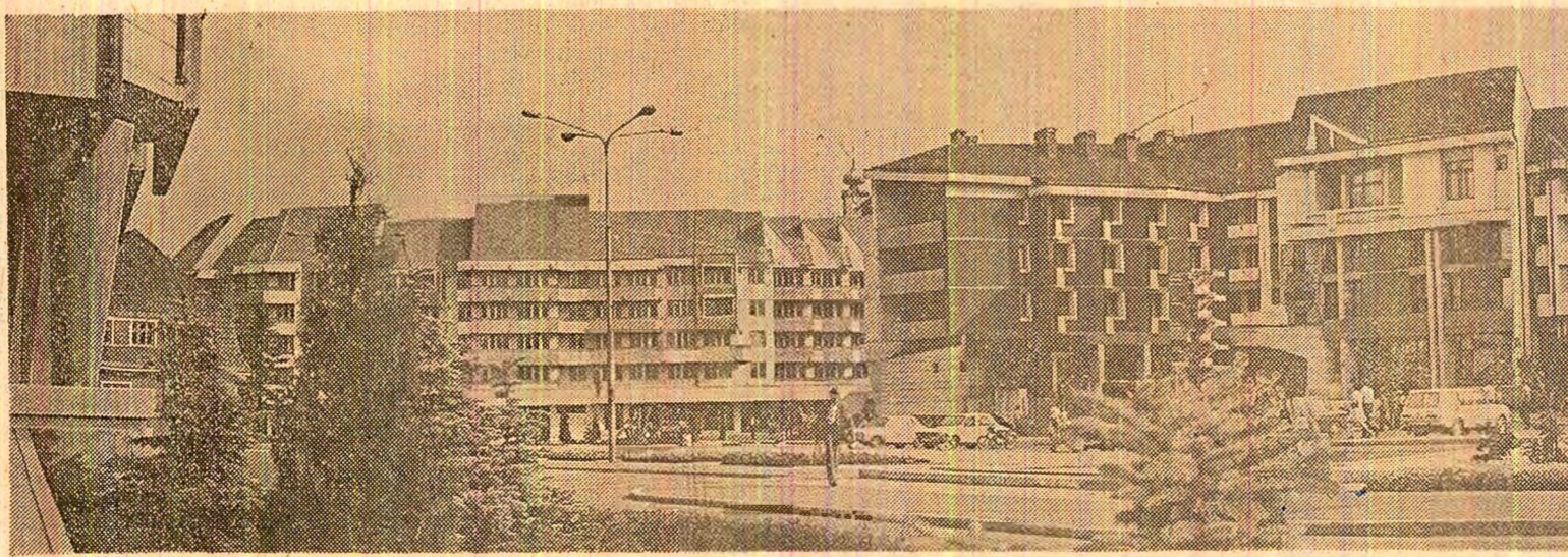
Bistrița - oraș care a cunoscut în ultimii ani, ca dealtfel toate localitățile patriei, o puternică dezvoltare urbanistică