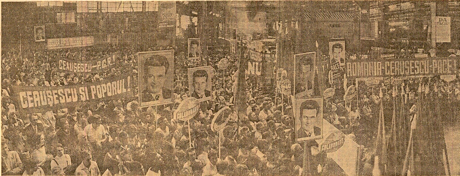
Imagine de la adunarea de ieri a oamenilor muncii de la Întreprinderea de mașini grele din București

În întreaga țară continuă adunări și mitinguri ale oamenilor muncii