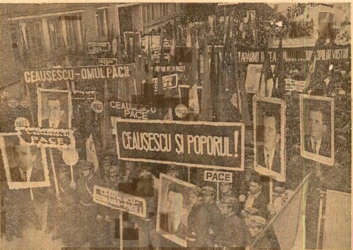
Relatări de la adunări și mitinguri ale oamenilor muncii din întreaga țară, în pagina a V-a