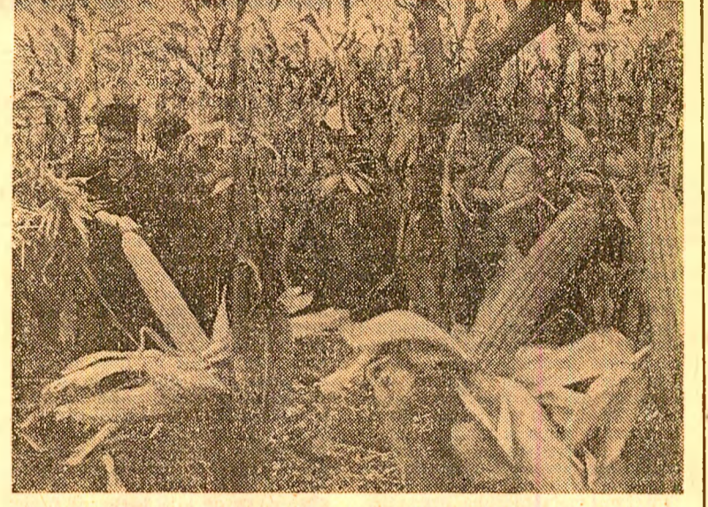
Studentii de la Institutul agronomic „Nicolae Bălcescu” din Capitală recoltează porumbul de pe terenurile stațiunii didactice experimentale Belciugatele, județul Călărași