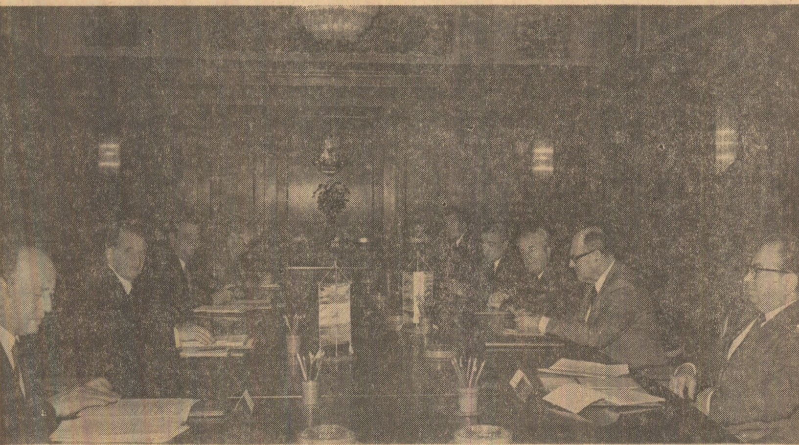
• Vizita tovarășului Mika Špiljak în municipiul Ploiești • Alte momente ale vizitei

tinental european, a înfăptuirii unor măsuri concrete de dezarmare, pentru afirmarea politicii de pace, de dezarmare, de încredere și colaborare internațională. Referindu-se la stările de conflict existente în lume, cei doi președinți au menționat că soluționarea justă și trainică a problemelor majore ale lumii contemporane impune participarea activă, responsabilă, în condiții de deplină egalitate, a tuturor statelor, fără deosebire de mărime sau orânduire socială, un rol important trebuind să-l aibă țăările mici și mijlocii, statele în curs de dezvoltare, nealiniate, care constituie marea majoritate a lumii, și care sunt nemijlocit și vital interesate într-o politică de pace, colaborare și respect al independenței naționale. Convorbirile se desfășoară în atmosfera de simă, prietenie și încredere reciprocă ce caracterizează relațiile dintre țările, partidele și popoarele noastre.