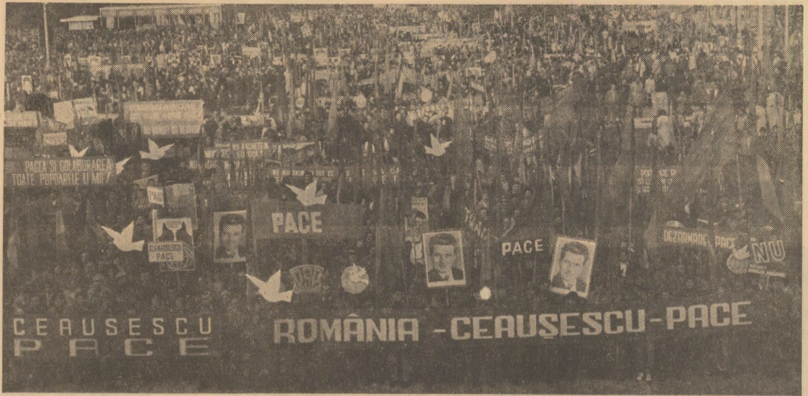
Adunarea pentru pace desfășurată in municipiul Ploiesti