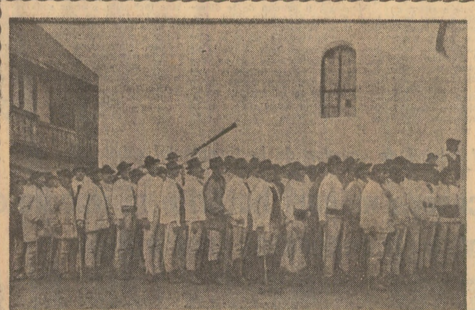
Delegația comunei Lupșa gata de plecare spre Alba Iulia

Pagină realizată de Gh. GURGIU, St. DINICĂ, Gh. CRISAN, S. ACHIM