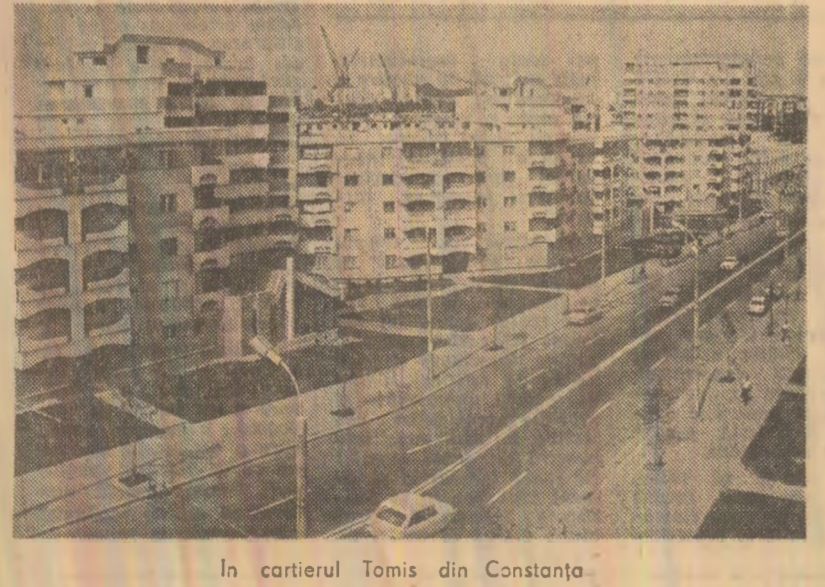
In cartierul Tomis din Constanța

Cu prilejul adunării au fost trimise scrisori ambasadelor U.R.S.S. și S.U.A. la București, ambasadelor tuturor statelor europene, precum și mesaje către Organizația Națiunilor Unite, in care se adresează chemarea de a se întreprinde acțiuni pentru curmare cursului inarmărilor, in primul rind al celor nucleare, pentru înfăptuirea dezarmării și asigurarea păcii.