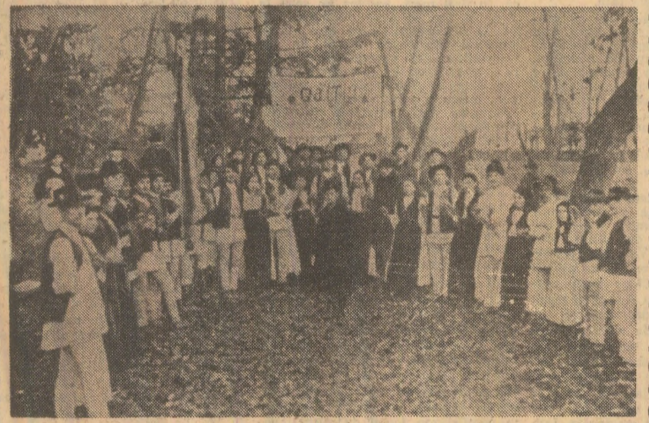
Sătenii din Găltiu înaintea plecării spre Alba Iulia