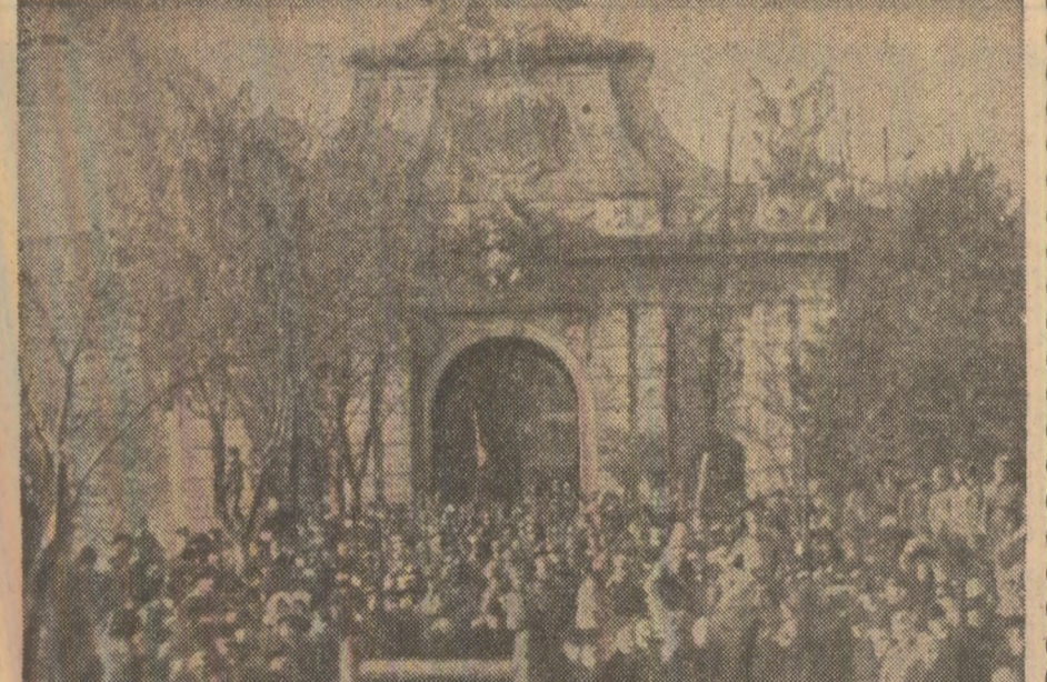
Mulțimile la poarta cetății din Alba Iulia