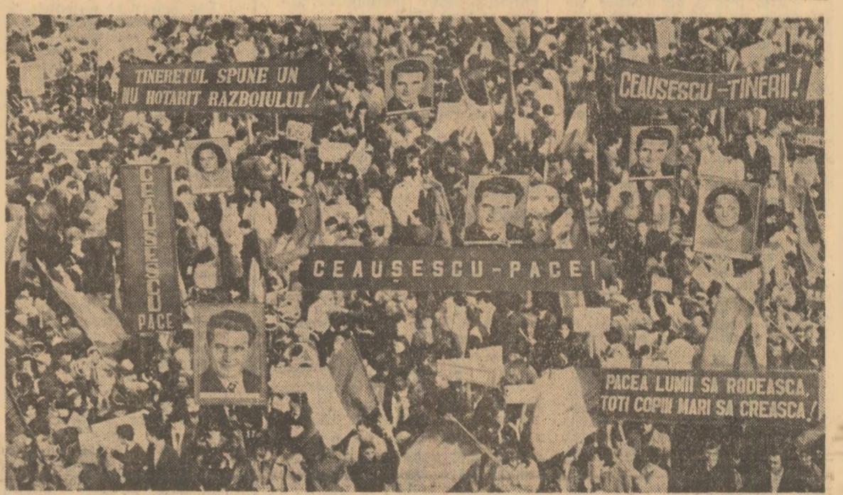
Aspect de la adunarea de ieri a tinerilor din Tîrgoviște.

Participanții au desemnat reprezentanții din județe la marea manifestare din Capitală a tineretului și copiilor, care se desfășoară sub genericul „TINERETUL ROMÂNIEI DOREȘTE PACEA”.