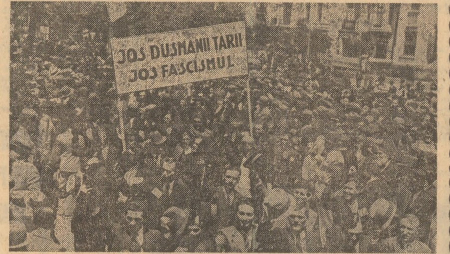
31 mai 1936: La uriașe mîngîngiri antifasciste, oamenii muncii din țara noastră și-au exprimat hotărîrea neastămutată de a apăra mărețe cuceriri ale poporului: unitatea și independența țării.

„C.C. al P.C.R. șeamă întregul popor la luptă hotărîtă împotriva războiului anticlerical și a dictaturii fasciste...“