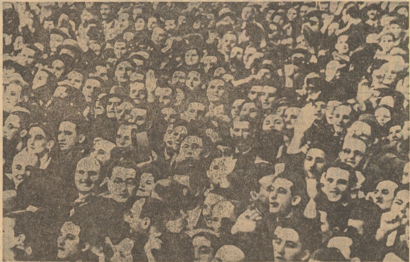
1 Mai 1913. La marea demonstrație din Capitală, din douăzeci de mii de piepturi muncitorești au răsunat gîndurile și viziunile întregului popor român: „Trăiască România liberă și democratică!“, „Jos fascismul!“, „Să apărăm hotarele României!“

„Căpitanii hotărîți ai neastărilor și uni-tății, socialiștii români, milionații clasei muncitoare...“