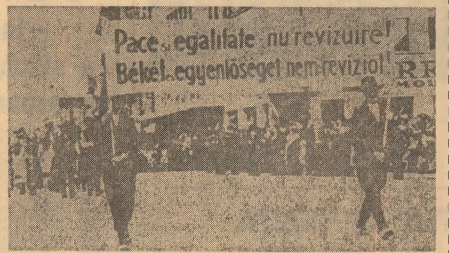
1940. Oamenii muncii, români și maghiari, manifestîndu-și la Cluj împotriva țării de politica agresivă a statelor fasciste.

Strins unită în jurul partidului, națiunea noastră socialistă înaintea cu încredere spre viitorul său comunist!