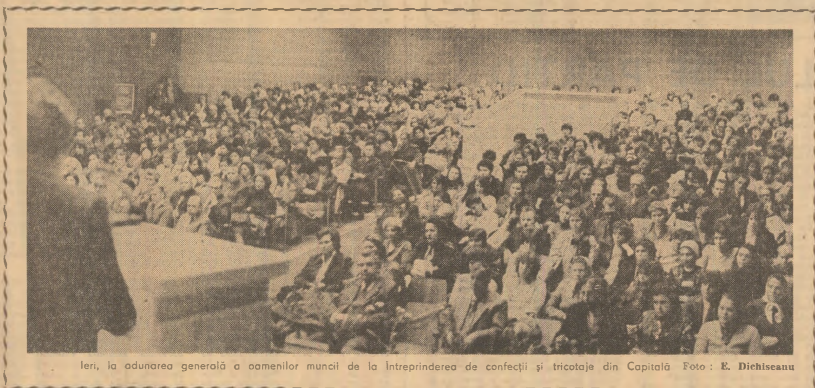
leri, adunarea generală a oamenilor muncii de la Întreprinderea de confecții și tricotaje din Capitală.

ții — prima de acest fel din țară — asigură o reducere a consumului de energie electrică cu circa 20 la sută. Majoritatea utajelor și echipamentelor noii instalații au fost realizate în întreprinderile de profil din țară. Se cuvine remarcat că întreg procesul de producție este automatizat. (Gheorghe Bălă, correspondentul „Scintei”).