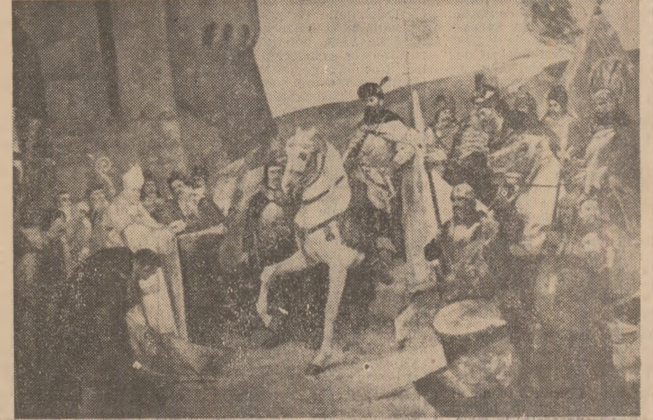
Intrarea triumfală a lui Mihai Viteazul în Alba Iulia. Pictură de Di Stoica