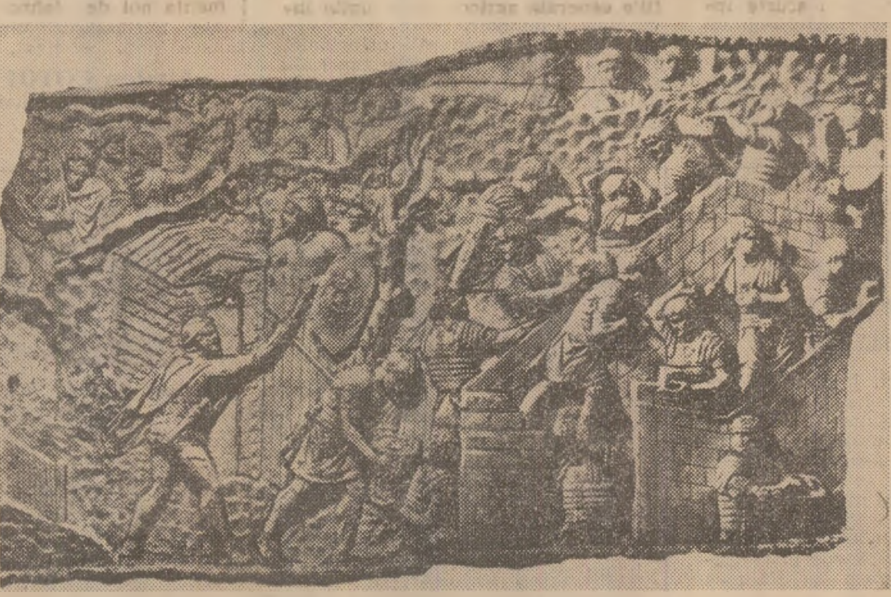
Dăluită în piatra Columnei — dirza rezistență a dacilor