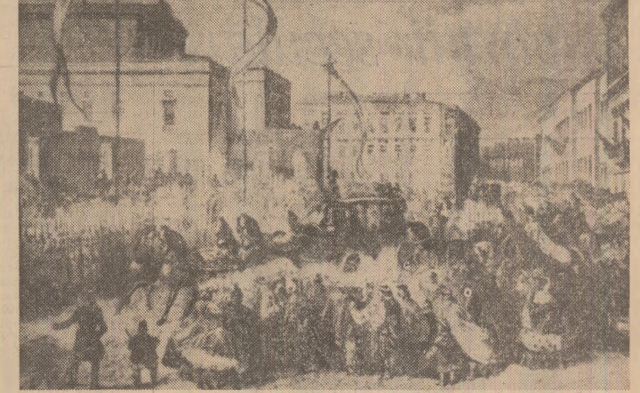
Alexandru Ioan Cuza în drum spre parlamentul din București