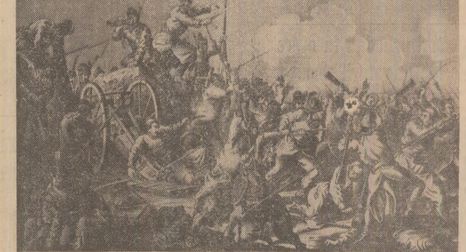
Dorobanții în asaltul de la Grivița, 30 august 1877

lul țărăn din Albac, Nicola Ursu Horea, cel care ridicăndu-și poporul la luptă pentru ca nobilii să nu mai fie a născut în gîndul contemporanilor imaginea vechii Dacii. La sud de Carpați flăcăra aceleiași lupte pentru drepturile și dreptățile românilor, a aprins-o Tudor din Vladimiri. Ochi noștri se opresc asupra revoluției de la Pades, a altor documente ale revoluției de la 1821. „Fraților citiți n-ați lăsat să se stingă în inimile noastre sfînta dragoste cea către patrie aduceți-voi aminte că sînteiți parți ale unui neam“ — chema Tudor, l-au răspuns mii și zeci de mii de oameni, căci totii simțeau aceeași uriasă nevoie ca să se redobîndească vechile libertăți ale țării. Si l-au răspuns cu inima și gîndul nu numai muntenii, ci și moldovenii — cu care, îndemna Tudor, să se stea într-o unire, ca „imnia ce sîntem de un neam și de o leasă“, ca ajutîndu-se unul cu altii să se cîștige libertățile celor două principate. Si la fel l-au răspuns țărăni ardeleni care într-un gînd și un suflet așteptau pe eraul cel nou, pe „Todoru“, pe „Toderas“, ca după ce izbîndea la sud de Carpați, să treacă muntii,