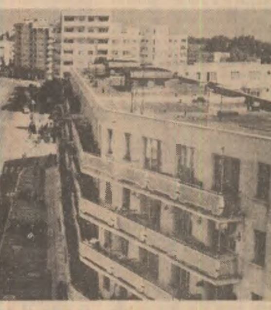
ROMAN: Veche urbe moldavă — nou oraș socialist

Între localitățile care în anii socializmului și-au înscris cu vigoare numele în rîndul centrelor industriale ale patriei se află și municipiul Roman, veche cetate muzuștină remarcabilă în economia antebelică doar prin existența unei dîntre cele mai vechi fabrici de zahăr din țară. În prezent, orașul de la confluența rîurilor Moldova și Siret se situează pe un loc de frunte în producția multor ramuri industriale. De pildă, întreprinderea de țevi realizează aproape jumătate din producția de țevi laminată a țării. În întreprinderea mecanică se construiesc structuri curățesce cu diametre de prelucrare pînă la 10 metri, iar mica și vechea fabrică de zahăr a devenit o mare unitate ce poate prelucra într-o singură zi 4.000 tone de sfeclă; în ultimii ani, Romanul a devenit și un oraș al industriei chimice prin construirea unei întreprinderi de fire și fibre poliamidice; industria materialelor de construcții este reprezentată aici de cea mai mare întreprindere de elemente prefabricate din beton