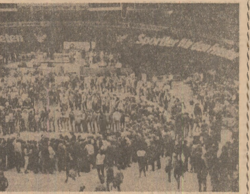
Participanții la un festival internațional, organizat la Dortmund (R.F.G.), s-au pronunțat împotriva instalării rachetelor nucleare, pentru pace și colaborare între toate popoarele. Printre cei prezenți se aflau politicieni, oameni de știință, artiști, sportivi de performanță

„Ziarul „AL-RAY” arată, între altele, că președintele Nicolae Ceaușescu este primul putînd să fie de stat care s-a ridicat, cu imparțialitate și curaj, împotriva amplasării rachetelor nucleare în Europa, chemînd la instaurarea unui spirit nou în relațiile Est-Vest.