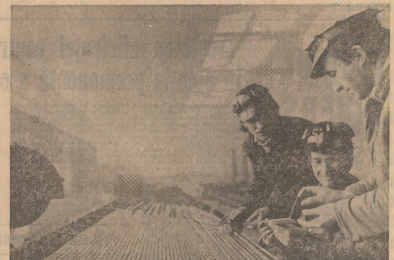
Productivitate, calitate, eficiență — iată deviza sub care își desfășoară activitatea în aceste zile colectivul întreprinderii de țevi „Republica” din Capitală. În imagine: aspect de muncă din secția laminare țevi inox.

Oamenii muncii din întreprinderile industriale ale municipiului Oradea au raportat îndeplinirea prevederilor de plan la producția-marfă pe întregul an. Datorită avansului de timp cistigat, în unitățile respective au fost create condiții ca pînă la finele anului să se obțină o producție-marfă suplimentară în valoare de 365 milioane lei. Se vor livra peste prevederi energie electrică pe bază de cărbune, confecții textile, tricotaie, materiale de construcții, alte produse utile economiei. În fruntea întrecerii se află colectivele de muncă de la Întreprinderea de confecții, „Electrocentrale”, „Solidaritatea”, „Drum Nou”, „Miorița”. Întreprinderea de subansamblu pentru mijloace de transport, „Alumina”, Întreprinderea pentru materiale de construcții, (Ioan Laza, corespondentul „Scînteii”).