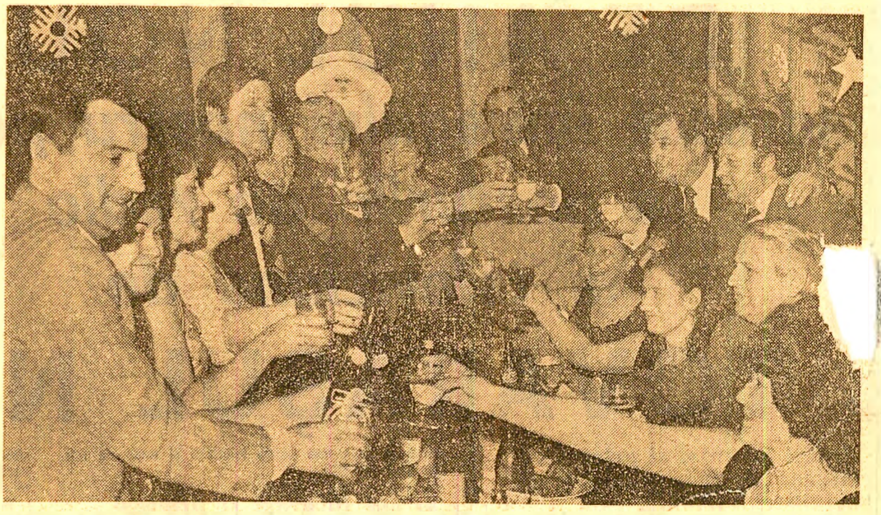
Revelion '84 la întreprinderea „Vulcan” din Capitală: în noaptea-noapților, veselia s-a aflat și aici la ea acasă