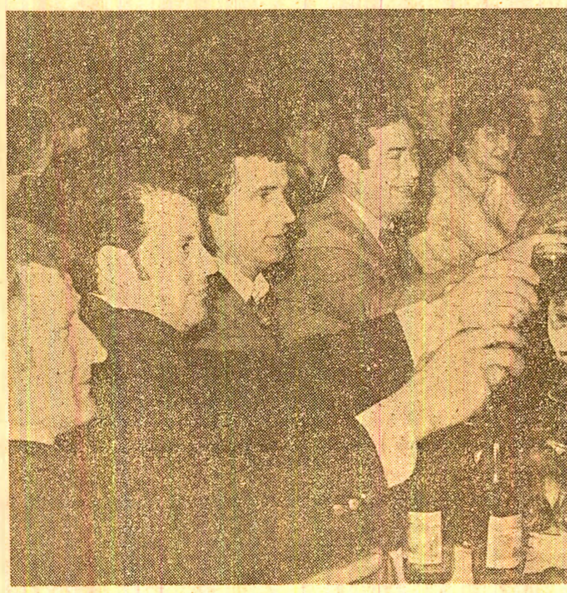
Întreprinderea de confecții și tricoteje — București: o cupă pentru noul an, cu bucurii clădite prin strădania tuturor

Anul nou, 1984, a venit și... într-o expoziție de desene ale copiilor, răz-