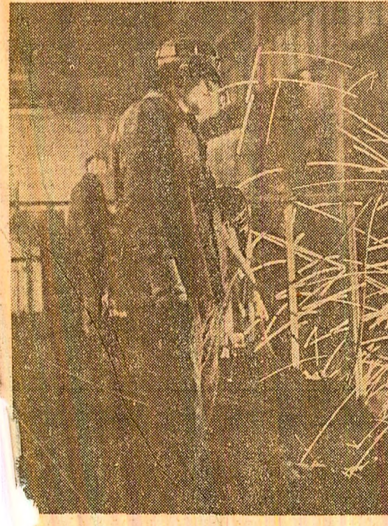
Activitate intensă în fața vetrelor încinse ale cuptoarelor. la Combinatul siderurgic din Galați.

carău utilaje și autobuscule de mare capacitate pentru țări din Extremul Orient. (G. Mihaescu).