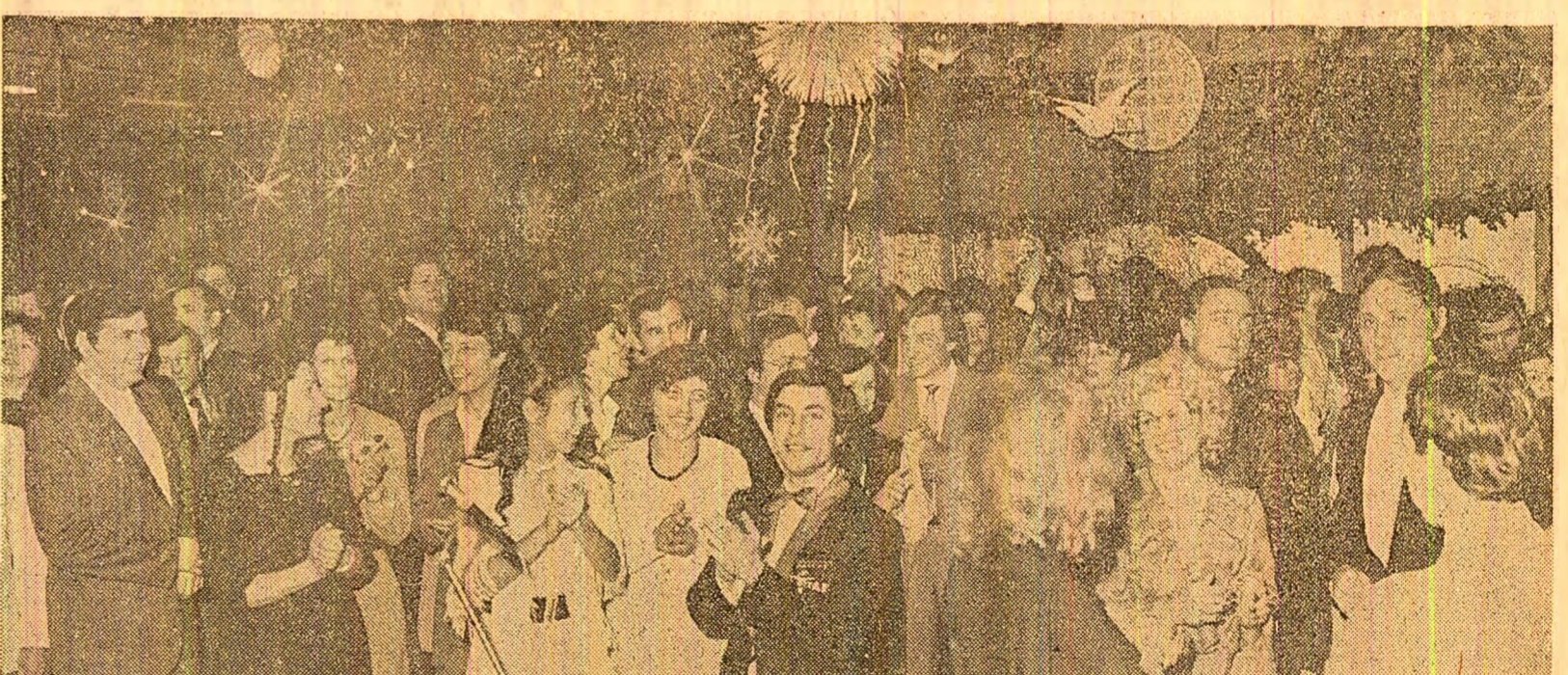
Optimism, încredere în împlinirile prin muncă în anul care a venit și la Revelionul muncitorilor de la Întreprinderea de mașini-unelte și agregate — București

Așa cum împede se înfăptuiează în Mesajul de An nou, intrăm în 1984 cu optimism, cu încredințarea fermă într-un an de noi succese pe frontul construcției socialiste, într-un an în care poporul român își afirmă tot mai puternic voința sa de înțiste și pace pe pămînt. Și de data aceasta năzuințele, speranțele noastre, atît de clar exprimate în Mesaj, atît de puternic întipărite în conștiința fiecărui, vor deveni, ca de fiecare dată, certitudini. Iar certitudinile — se știe lucrul acesta — se nasc din strădania întregului popor, călît la flacăra idealului comunist al patriei, mai unit ca oricînd și încredător în drumul de progres continuu al României socialiste. Mesajul de An nou dă relief puternic gîndului și simțirii românești acum, la început de an, înflăcărează și îmbrăbățează, galvanizează conștiințele, descătușează energiile, indică direcțiile de acțiune pentru a face din 1984 un an al marilor noastre izbîni în toate compartimentele vieții sociale și spirituale, un an al păcii și colaborării între popoare, un an despoșat de competiția absurdă a înarmărilor, de amenințarea cu dezastrul nuclear. Sînt ideile și momentele pe care le-au înregistrat și pe care încearcă să le redea mai jos reporterii și corespondenții „Scinteia” aflați și ei, la datorie, în frumoasa noapte de la frontiera dintre ani.