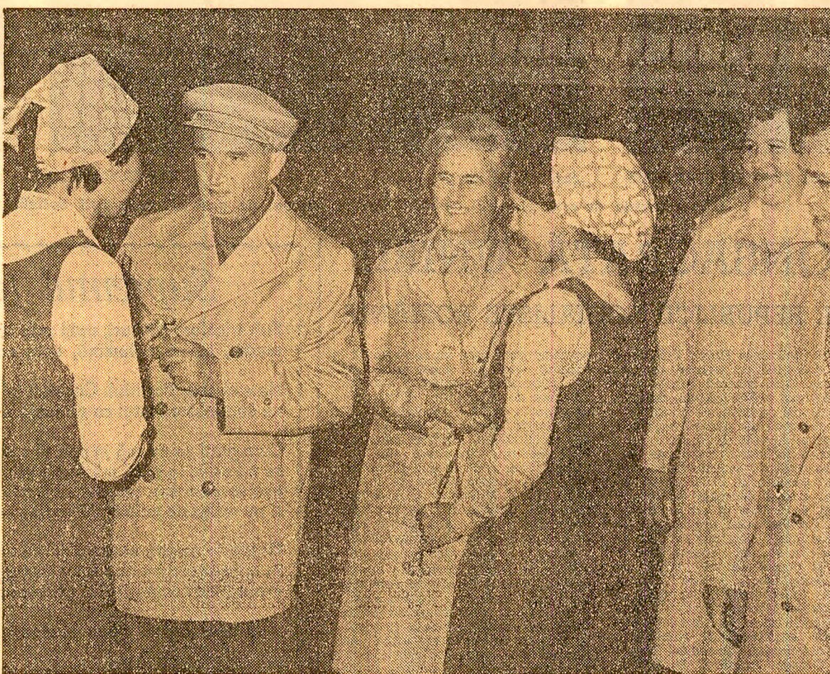
Momente emoționante din întîlnirile tovarășului Nicolae Ceaușescu cu oameni ai muncii

În cei 19 ani, tovarășul Nicolae Ceaușescu a participat la 207 congrese, conferințe, consfătuiri, ședințe și întîlniri de lucru la nivel național, care au reunit cadre de conducere și oameni ai muncii din toate domeniile de activitate.