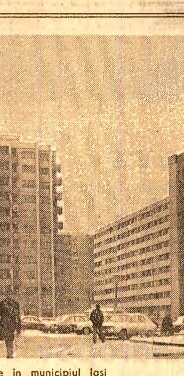
Noi construcții de locuințe în municipiul Ișiș