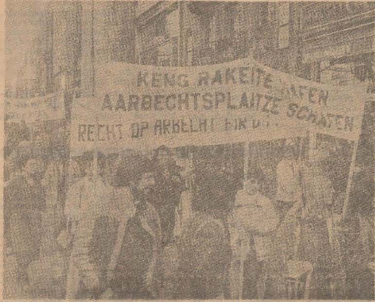
La Luxemburg, ca și în alte țări ale Europei occidentale, continuă să se desfășoare ample activități de proiectare și studii de fezabilitate pentru amplasarea pe continent de noi rachete nucleare cu rază medie de acțiune. Îngrășirilor opiniei publice este sporită de faptul că una dintre bozlele unde urmează să fie amplasate aceste rachete (Bitburg — R.F.G.) se află la numai 100 km distanță de granițele Luxemburgului. În fotografia: o demonstrație în Luxemburg sub lozina „Impotriva rachetelor, pentru asigurarea dreptului la muncă!”

În schimbarea roștită cu prilejul semnării acestui acord, președintele mozambican a arătat că s-a ajuns la acest acord în ciuda faptului că „deosebirile dintre concepțiile politice, economice și sociale sînt mari și terribil antagoniste” între Mozambic și R.S.A. Subliniind, de asemenea, semnificativa economică a acestui acord, el a arătat că „nu poate exista dezvoltare fără pace și liniște”.