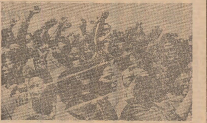
„Pentru drepturi egale între toți cetățenii, indiferent de culoare” — sub acestor lozinci în numeroase localități din R.S.A. au avut loc manifestări și acțiuni de protest ale populației africane majoritare în sprijinul unei revendicări susținute de întreaga comunitate internațională

la Sharpeville (1969) și Soweto (1976), cînd forțele de reprimare au răspuns cu gloante de demonstranților pasnice ale populației de culoare, ucigînd mii de oameni și copii. Potrivit datelor O.N.U., în închisorile din R.S.A. zac mii de patrioți, supuși unui regim deosebit de dur printre ei aflîndu-se și liderii Congresului Național African, Nelson Mandela, Walter Sisulu, Raymond Kathada și mulți alții. Dacă apartheidul și practicile sale inumane se află în permanență în centrul atenției mișcărilor anti-rasiale, nu e mai puțin adevărat că discriminarea rasială se manifestă sub forme mai mult sau mai puțin grave și în alte regiuni ale globului. Este vorba de situația unor întregi comunități din țările capitaliste, din regiunile cărora se recreează cel mai mare număr al șomerilor și ai căror membri sînt nevoiți să trăiască în cartiere mizerice, îngrădiți de tot felul de restricții discriminatorii și găsește, de asemenea, ilustrație în destinul dramatic al imigranților, a căror viață se desfășoară tot mai mult sub semnul înecătorilor în existența precară a populației palestinene din Clistorand și Gaza, în general din teritoriile ocupate din Orientul Mijlociu, care este mereu confruntată cu arbitrarul și reprimările. Condițiile de trai ale tuturor acestor victime ale discriminării ra-