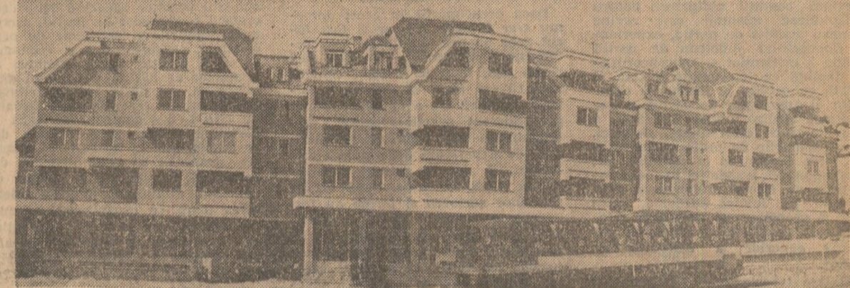
Sîntu Gheorghe — un oraș frumos, modern, pe măsura dezvoltării sale economice și sociale din ultimul deceniu