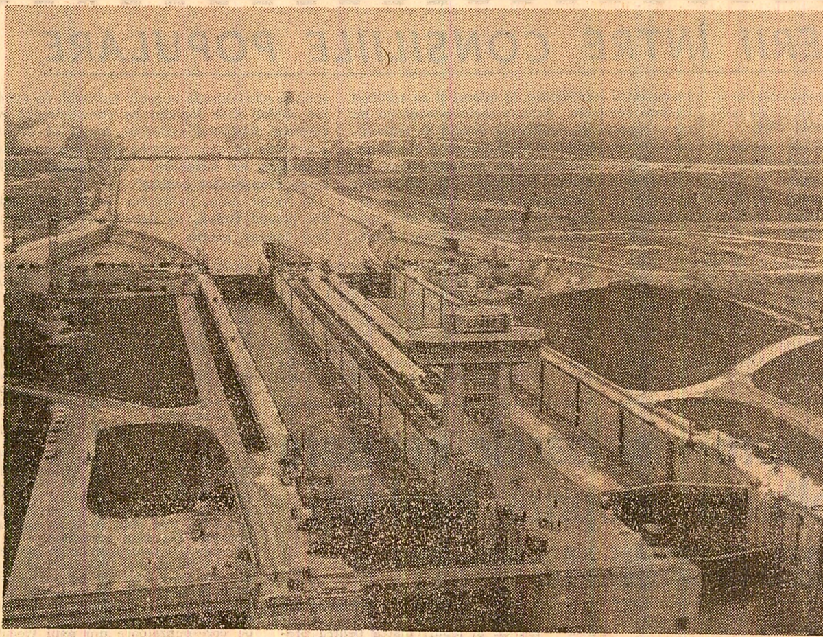
Ecluza de la Agigea, „poartă” de intrare a Dunării în Marea Neagră

„Scinteia” în legătură directă cu bazele miniere ale țării