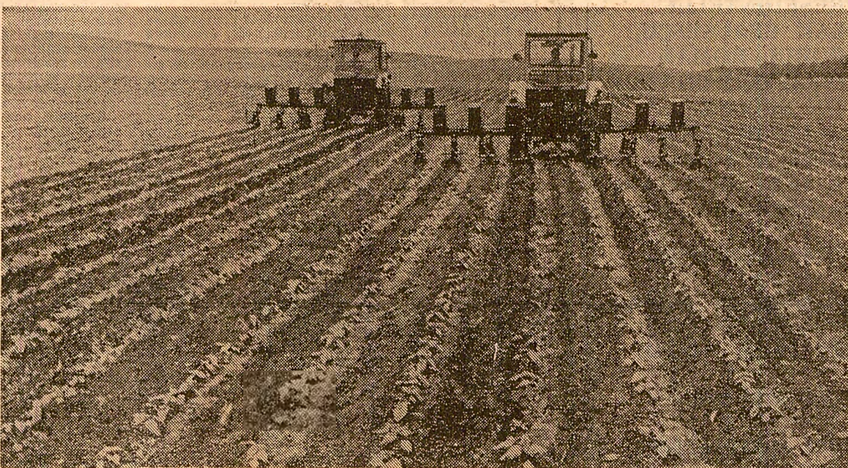
Prășitul florii-soarelui la cooperativa agricolă din Peretu, județul Teleorman.

Lucian CIUBOTARU Rodica SIMIONESCU correspondenții „Științei”