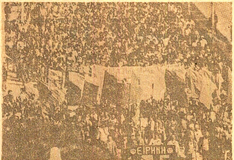
„Afară cu bazele morții!”, „Balcanii — fără arme nucleare!”, „Pacea poate fi apărută” — sub eticheta lozinei, la Nea Makris, în Grecia, s-a desfășurat o puternică demonstrație, la care au participat mii de persoane din numeroase localități ale regiunii

pericolul unei conflagrații nucleare reprezintă cea mai mare sferidă de până acum la adresa continuității vieții omenești pe Terra.