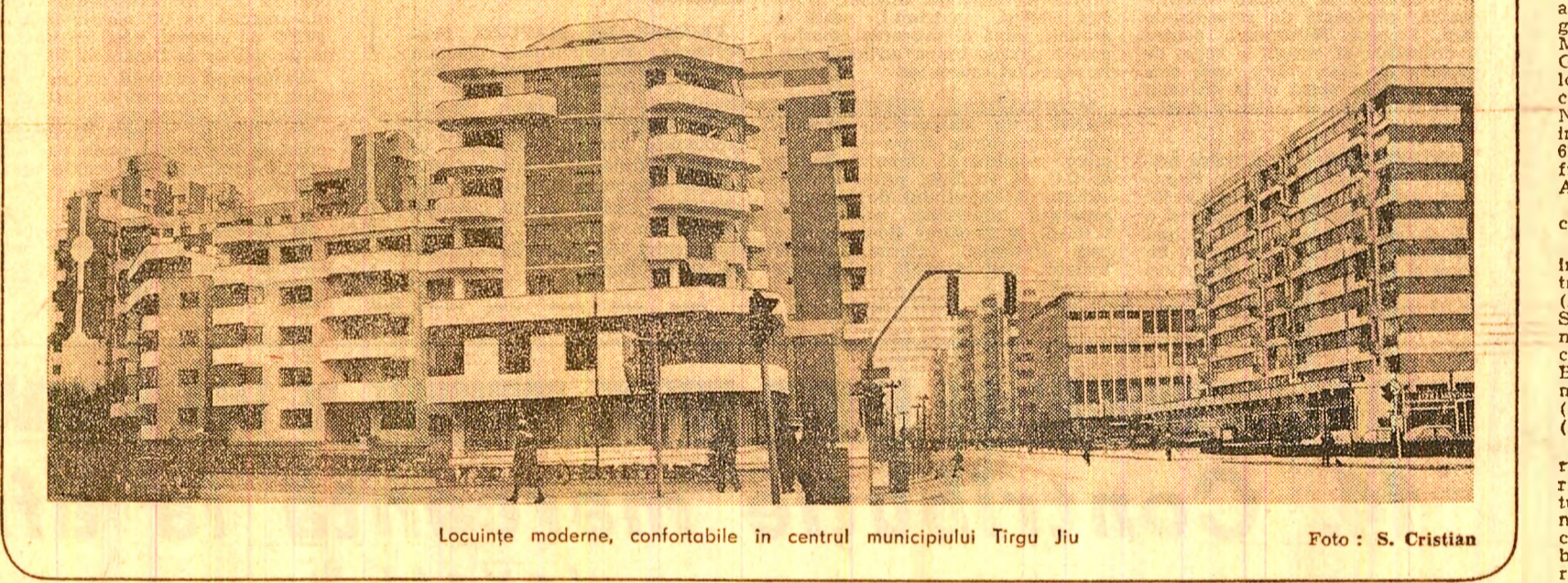
Locuințe moderne, confortabile în centrul municipiului Tirgu Jiu