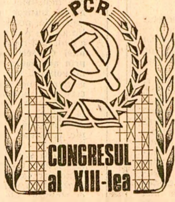
CONGRESUL al XIII-lea