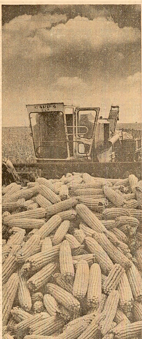
La I.A.S. Zimnicea — județul Teleorman, lanurile de porumb au rodit îmbușugat și în această toamnă, pe măsura hărniciei și priceperii oamenilor de aici, recunoscuți în țară pentru recoltele mari și constante pe care le realizează an de an.