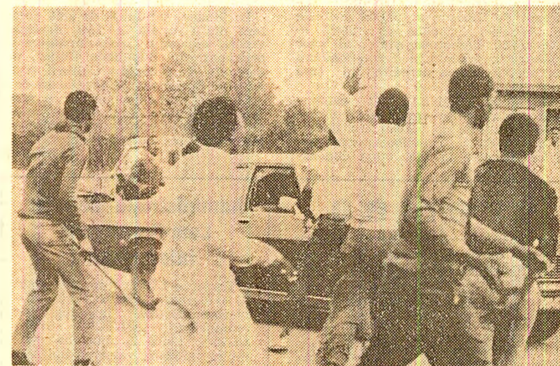
În semn de protest împotriva așa-zisei „reformă constituționale”, care menține practicile inumane ale apartheidului, în Republica Sud-Africană continuă să aibă loc demonstrații ale populației majoritare. Ele se desfășoară în diferite colturi ale acestei țări și mai ales la Soweto, cunoscută suburbie a orașului Johannesburg, unde în ultimele zile s-au înregistrat violente ciocniri între manifestanți și poliție. După cum transmit agențiile internaționale de presă, forțele de reprimare au făcut uz de gaze lacrimogene și gloante de cauciu, pentru a împiedica de manifestanți. În fotografie: aspect din timpul manifestațiilor antiapartheid din Soweto

În cuvîntarea la adunarea populară din municipiul Timișoara, secretarul general al partidului nostru a exprimat satisfacția față de dezvoltarea puternică a mișcărilor pentru pace din Europa și din diferite alte regiuni ale lumii, evidențînd hotărîrea unui număr de orașe și chiar a unor state de a se declara zone sau state fără arme nucleare. Puniind în lumină asemenea rezultate obținute pînă în prezent de uriașă mișcare pentru pace a popoarelor, tovarășul Nicolae Ceaușescu a arătat, încă o dată, că numai acționînd unite, cu tot mai multă fermitate, mișcarea pentru pace, popoarele de pretutindeni pot opri cursul periculos al evenimentelor, pot asigura pacea. Sînt cuvîntare care se constituie într-o puternică chemare adresată forțelor sociale-politice celor mai largi de a face totul pentru înlăturarea pericolului distrugerii nucleare, pentru asigurarea dreptului suprem al oamenilor la existență, la dezvoltare pasnică.