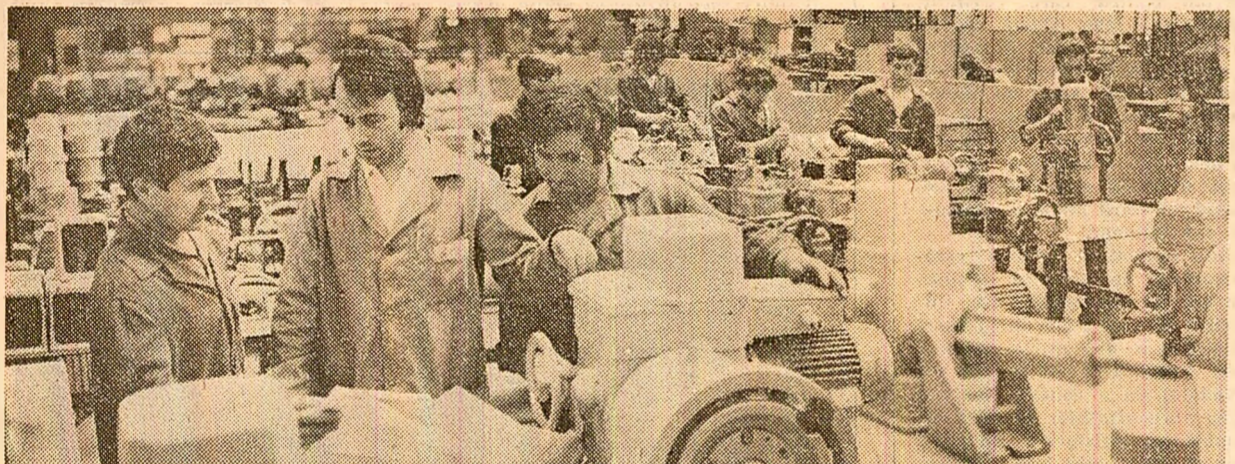
Întreprinderea mecanică din Vaslui. În secția servomecanisme, un nou lot de produse este gata pentru a fi expediat beneficiarilor.