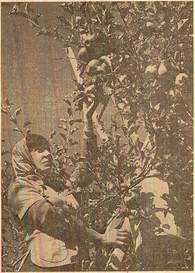
În livezile județului Dimbovița o început culesul merelor.