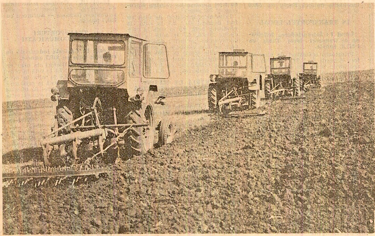
În cooperativa agricolă Fintinele, județul Teleorman, mecanizatorii pregătesc terenul pentru însămînțări.