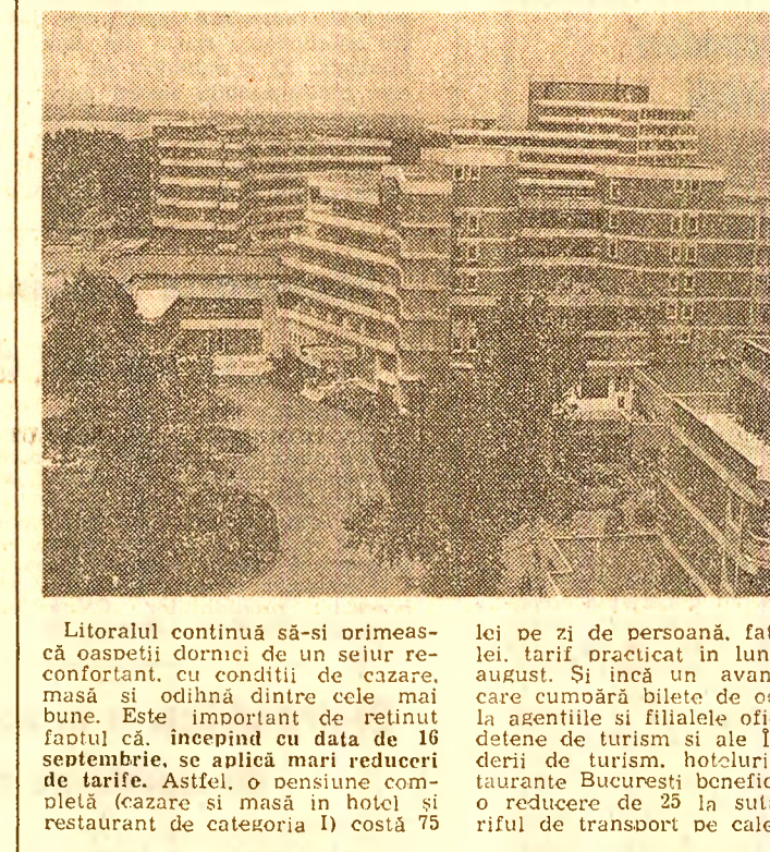
Litoralul continuă să-și orimească oaspeții dormiri de un sejur reconfortant...