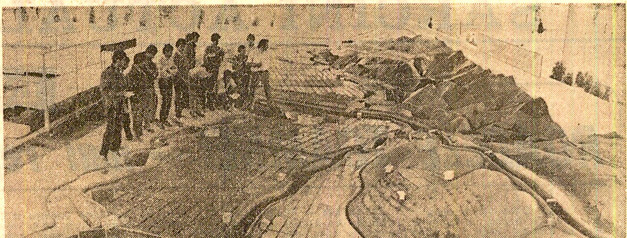
În laboratorul de irigaţii şi drenaje al Facultăţii de hidrotehnică din Iaşi.

editoriale de ecou trebuie să aibă în urmă ani de muncă şi cercetare, analize nuanţate, întreprinse de pe platforma unei prestigioase culturi ştiinţifice şi general filozofice.