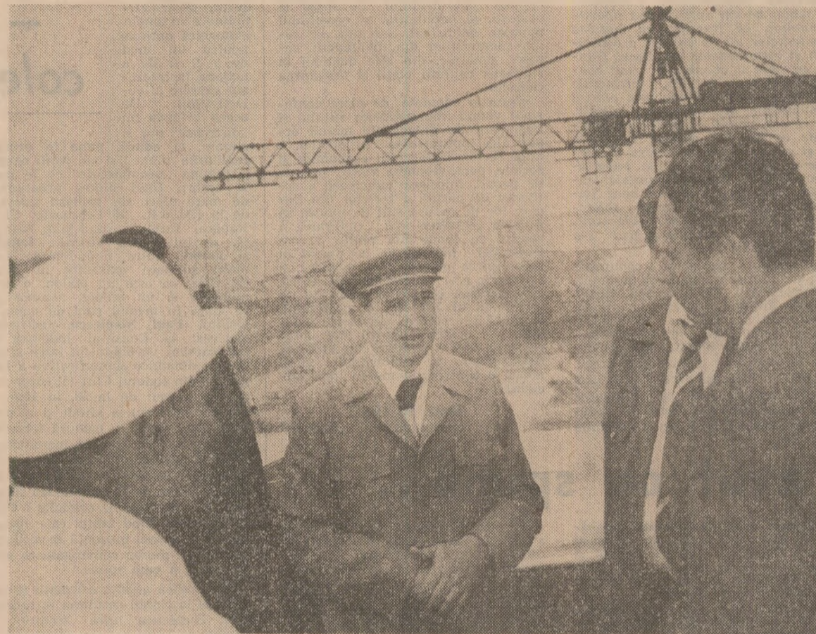
3 IULIE 1981: Tovarășul Nicolae Ceaușescu a examinat la fața locului stadiul lucrărilor pe marele șantier al hidrocentralei Porțile de Fier II.