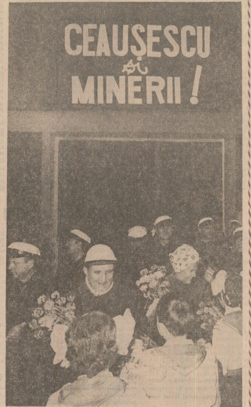
Cu sentimente de înaltă prețuire și cinstire, minerii, copiii acestora întimpină pe tovarășul Nicolae Ceaușescu și tovarășa Elena Ceaușescu în cadrul uneia dintre vizitele de lucru în bazinul carbonifer al Văii Jiului