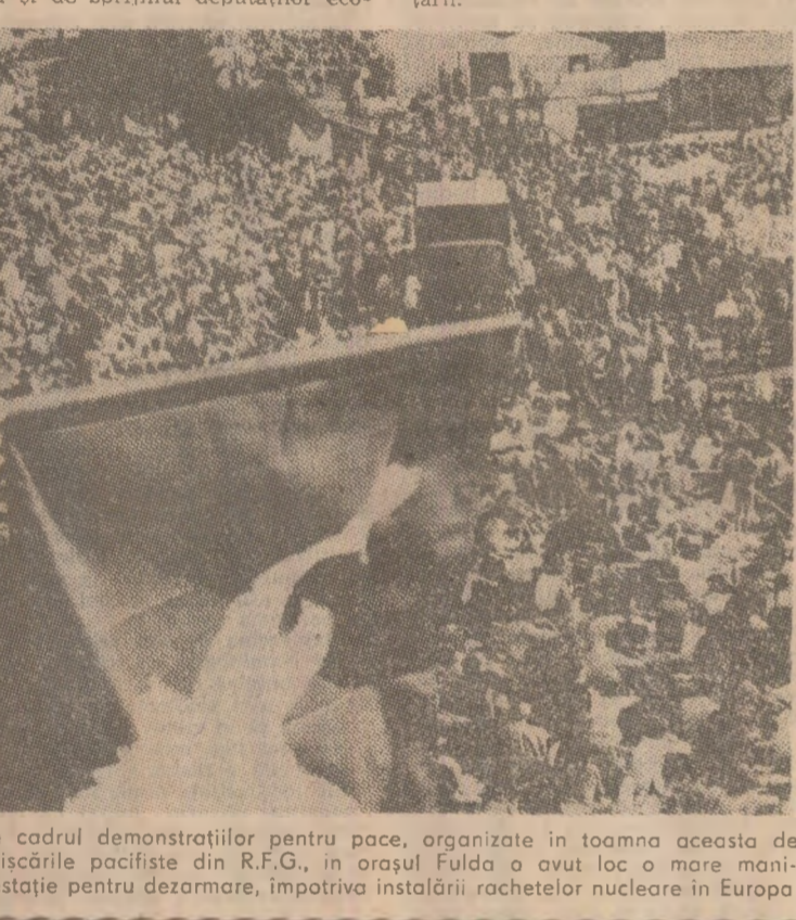
În cadrul demonstrațiilor pentru pace, organizate în toamna aceasta de mișcările pacifiste din R.F.G., în orașul Fulda a avut loc o mare manifestație pentru dezarmare, împotriva instalării rachetelor nucleare în Europa