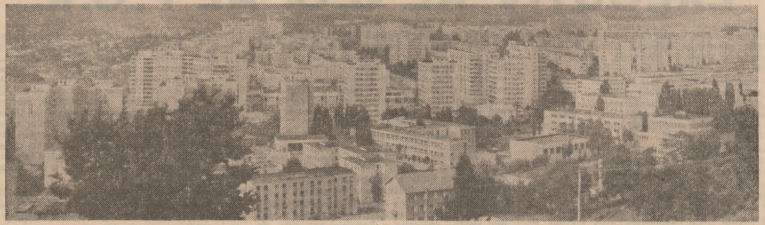
Peste 80 la sută din populația municipiului Piatra Neamț locuiește azi în case noi. O realitate semnificativă pentru vasta operă de construcție inițiată și îndeplinită sub conducerea partidului pe întreg cuprinsul țării