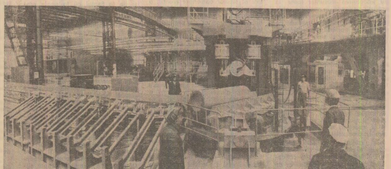
Noul laminor de la Roman, unul din marile obiective industriale înălțate după Congresul al XII-lea al partidului