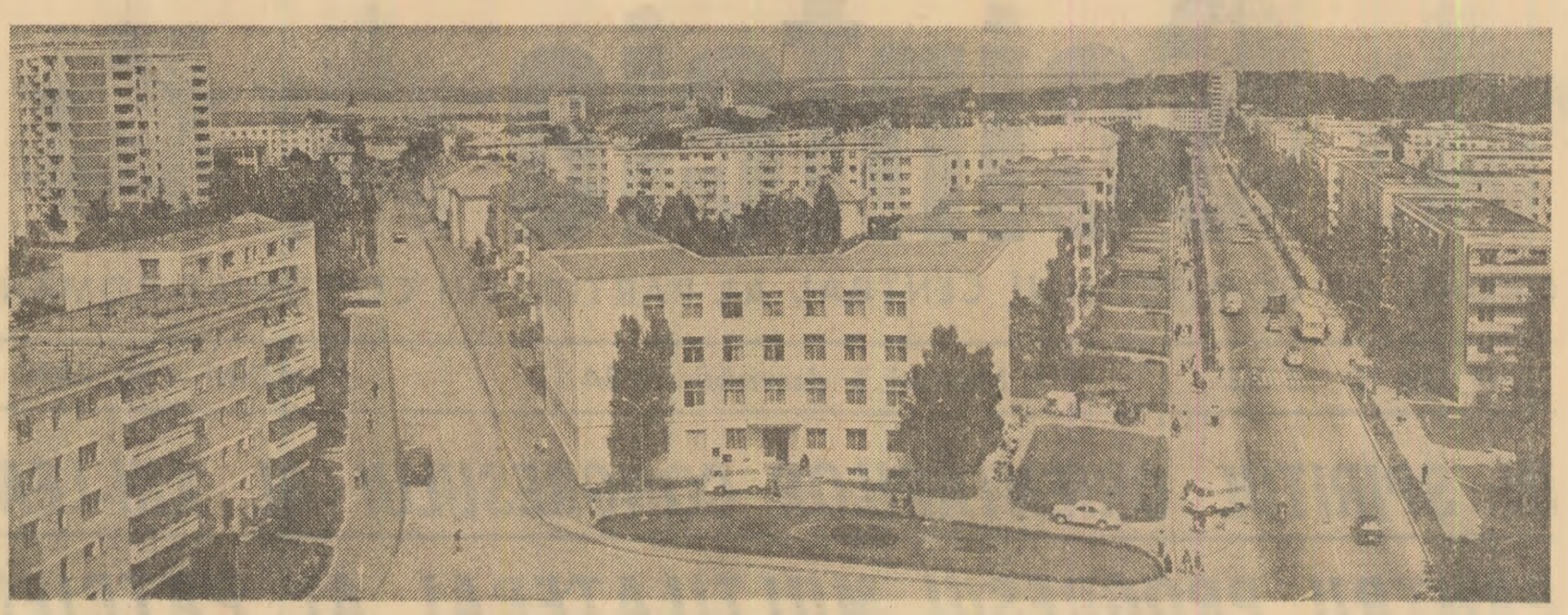
Arhitectură nouă în vechea cetate a Sucevei