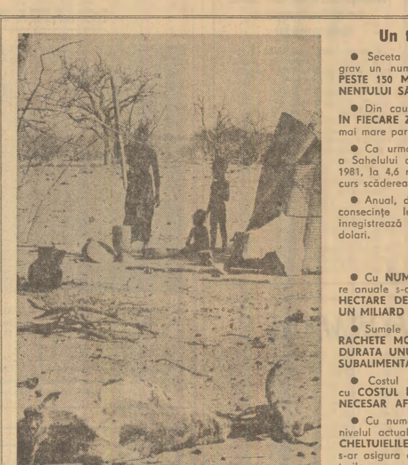
Un tragic paradox: TEZĂ

Dar dacă elementele climatice explică seceta, ele nu pot explica singure transformarea pămîntului în deșert. Aceste consecințe depind și de o serie de alți factori, printre care la loc de frunte se situează deshidratarea. Criza petrolului și oarecăr sporirea considerabilă a consumului