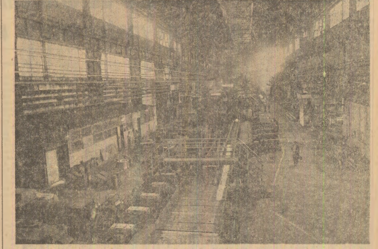
Astăzi, la Cîmpia Turzii se produce tot oțelul țării în toată România anulul naționalizării. În fotografie: o zi de muncă obișnuită la laminorul de sîrmă

Intins rufe... Astăzi, sîrma alcătuiește sistemul nervos al complicatelor aparate și utilaje, face parte din structura de rezistență a celor mai importante construcții. La Cîmpia Turzii se produce tot oțelul țării — și nu în ultimul rînd — producem oțel laminat și oțel calibrat, electrozi și fluxuri de sudură, cabluri din oțel și cabluri electrice și multe altele. — Așadar, putem vorbi