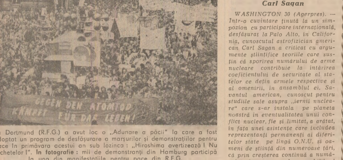
„Să fie înlăturat pericolul atomic!”

„Hiroshima avertizează!” La Dortmund (R.F.G.) a avut loc o „Adunare a păcii” la care a fost adoptat un program de desfășurare a marșurilor și demonstrațiilor pentru pace în primăvara acestui an sub lozincă: „Hiroshima avertizează! Nu raketelor!”.