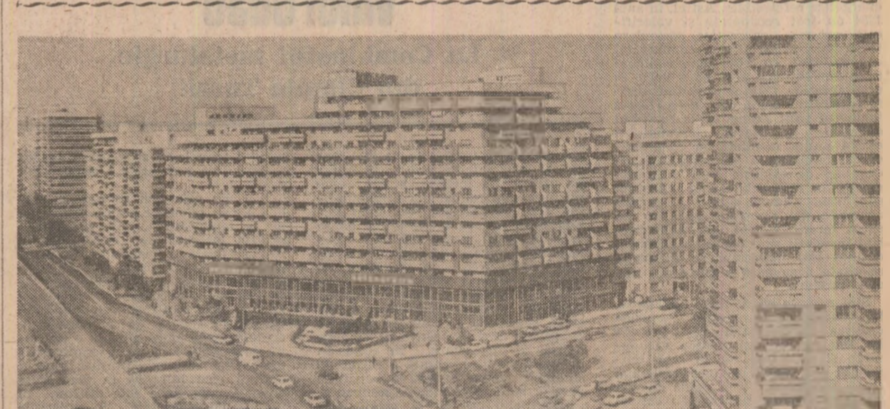
O dovadă elocventă a înnoirilor urbanistice ale Bucureștiului: noile construcții din Piața Socului

Pe platforma combinatului metalurgic din Tulcea a fost racordată la circuitul productiv o nouă capacitate de producție. Este vorba de cel de al treilea cuptor de siliciu tehnologic, cu o capacitate anuală de producție de 2500 tone. Prin finalizarea acestui nou obiectiv economic se asigură producerea la Tulcea a întregului necesar de siliciu tehnologic, eliminîndu-se astfel importul acestui deosebit de solicitat aliaj metalurgic. De remarcat faptul că