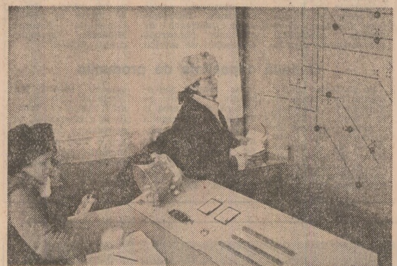
Dispeceratul carierei miniere de la Rovinari

întărirea ordinii și disciplinei, pentru o atitudine responsabilă în muncă în toate sectoarele, în vederea realizării în cele mai bune condiții a programelor de dezvoltare a patriei noastre în noua etapă de fabricare a societății socialiste multilaterale dezvoltate. În acest scop, este necesar ca, pretutindeni, în toate unitățile economice, adunările generale să se manifeste ca adevărate tribune ale afirmării plene a responsabilității și exigenței muncitorilor, a ideilor inovatoare și experiențelor pozitive, astfel încît, pe baza gândirii colective, să se stabilească măsurile și soluțiile tehnice și organizatorice cele mai bune pentru înfăptuirea tuturor indicatorilor de plan pe anul 1985, în strînsă concordanță cu hotărîrile Congresului al XIII-lea al partidului, cu exigențele actuale etape de dezvoltare a economiei noastre naționale.