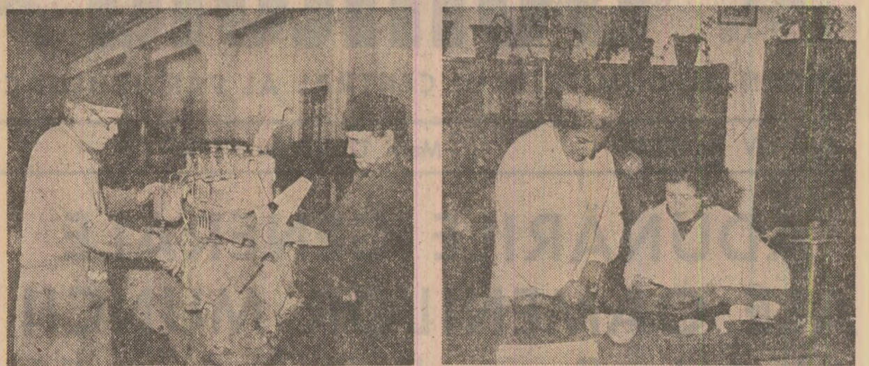
Doă imagini, aceeași preocupare pentru pregătirea temeinică a campaniei de primăvară: Repararea tractoarelor la S.M.A. Bărcănești, județul Prahova (stînga); controlul semințelor la Inspectoratul județean Vrancea (dreapta)