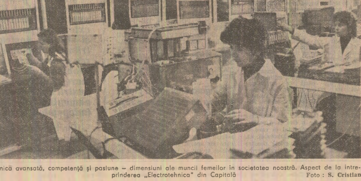
Tehnică avansată, competență și pasiune — dimensiuni ale muncii femeilor în societatea noastră. Aspect de la întreprinderea „Electrotehnică” din Capitală.

Rodica SERBAN cu sprijinul corespondenților „Scintei”