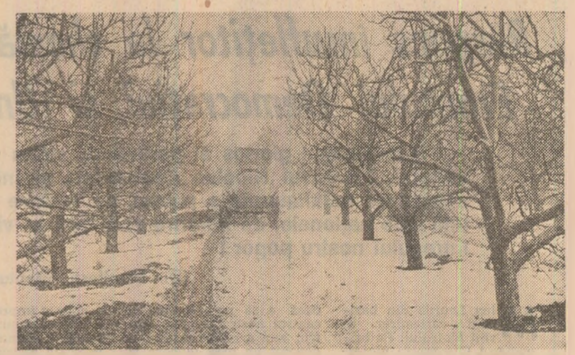
Lucrări de sezon în livezile Stațiunii de cercetări pentru pomicultură Focșani

ne-am propus ca în acest an pe jumătate din suprafața cultivată cu porumb, adică pe 650 hectare, să obținem 20.000 kg ștuleți la hectar”. Specialiștii consiliului agroindustrial nu au spus că la cursurile învățămîntului agrotehnic a fost popularizată pe larg experiența cooperativei agricole din Rîmnic. În acest an, în cooperativele agricole din consiliul agroindustrial Cogealac vor fi cultivate 9.300 hectare cu porumb, din care pe 7.960 hectare s-a prevăzută să se realizeze 20.000 kg ștuleți la hectar. În acest scop, au și fost fertilizate cu îngrășăminte naturale, ca la grădinișcă, aproape 1.500 hectare. Întreaga suprafață este arată din toamnă, sint asigurate îngrășămintele chimice și erbicidale necesare. S-au luat, de asemenea, măsuri de permanentizare pe solele respective a cooperativelor care lucrează la irigații, pentru creșterea lor în vederea executării unor lucrări de calitate bună. Există și sămînțit din cel mai productiv hibrid — F 420. Însă pentru esalo-