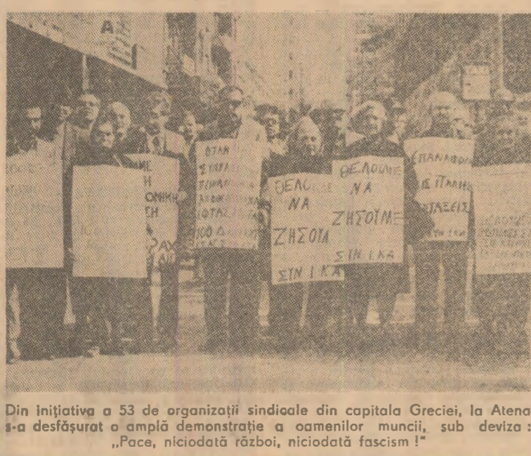
Din inițiativa a 53 de organizații sindicale din capitala Greciei, la Atena s-a desfășurat o amplă demonstrație a oamenilor muncii, sub deviza: „Pace, niciodată război, niciodată fascism!”