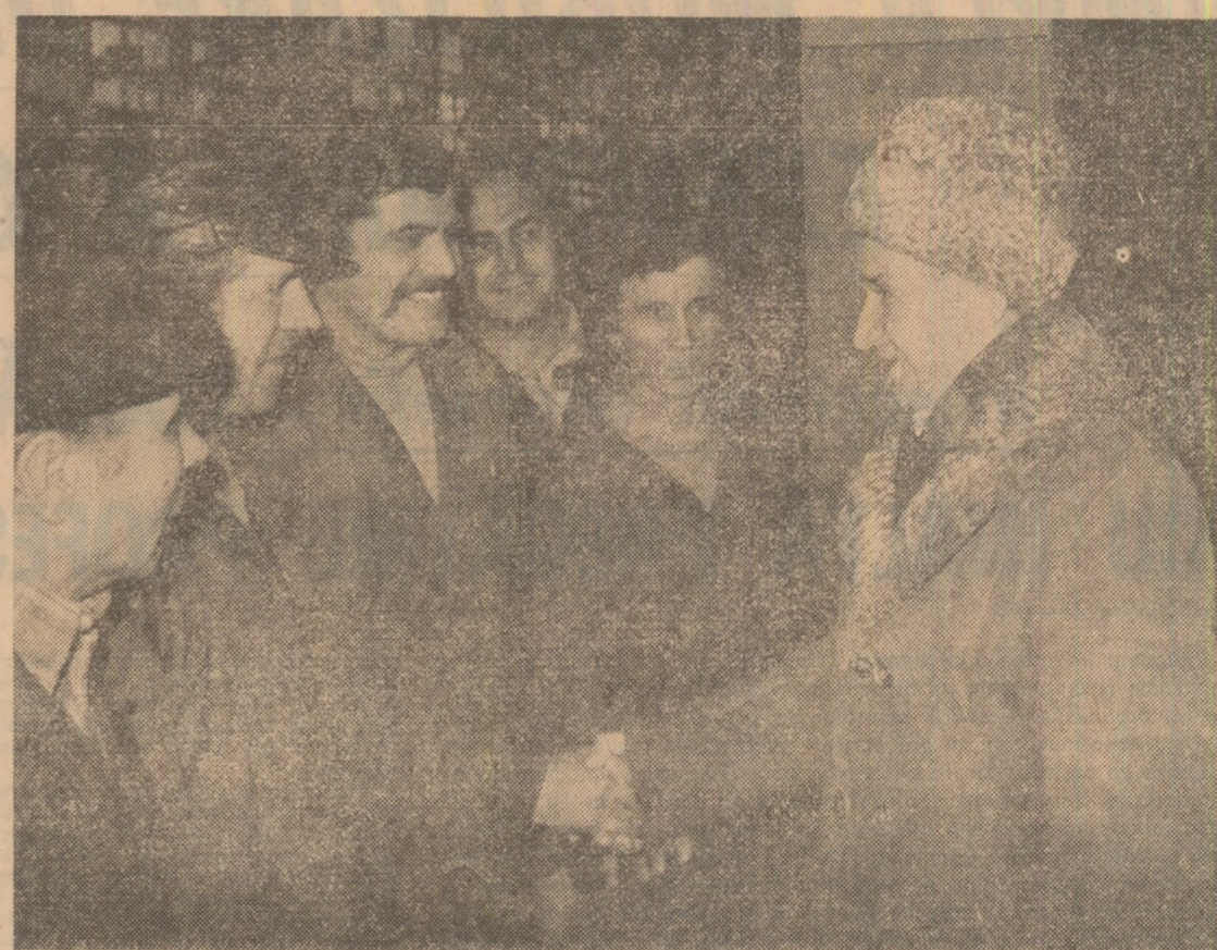
3 FEBRUARIE 1983. Tovarășul Nicolae Ceaușescu este primit cu alese sentimente de dragoste, prețuire și recunoștință de către muncitorii Intreprinderii de mecanică fină Sinaia.