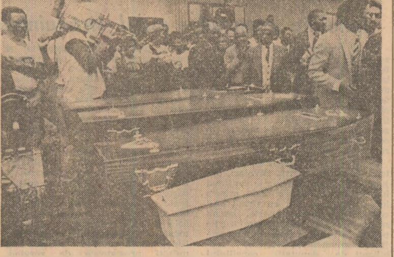
La Crossroads au avut loc funeraliile celor 16 persoane care și-au pierdut viața în timpul recentelor manifestații, reprimare cu sălbăcie de poliție. Printre scrie se poate vedea și cel al unui copil de numai două luni