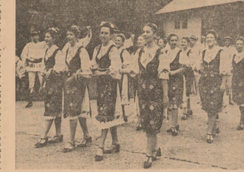
Ansamblul folcloric „Doina Bucureștilui”, într-un spectacol de succes, în Muzeul satului.

cu înalt conținut educativ. Nu întîmplător este faptul că formații artistice se află în unități de primă mărime, cu remarcabile rezultate în producție, ceea ce dovedește pe deplin justetea și caracterul profund stimulant al aprecierii că la toate manifestările festivalului un rol de frunte trebuie să-l aibă cel harnic, oamenii care își fac exemplarul din muncă, în activitatea colectivelor din care fac parte. Puteți spune și aici, în cadrul activității artistice din festival, participă cei harnici, cei care intruchipează trăsăturile promovate de codul nostru etic. La Clubul „Grivița”, la Casa de Cultură și Tineret „Mănușă” și „Modern-Club” pe agenda manifestărilor ultimelor luni, se situează spectacolele dedicate frunțarilor în producție. Ele sînt, totodată, spectacole-examen în actuala etapă a celei de-a 5-a ediții a Festivalului național „Cintarea României” la care s-au prezentat formații profesioniști și de amatori, de cele mai diverse formule. „Dialogul artiștii amatori-artiștii profesioniști este o permanență în activitatea noastră — ne spune prof. Ion Ștefănescu, instructor al Consiliului sindicatelor al sectorului 1. Este știut că actorul Victor