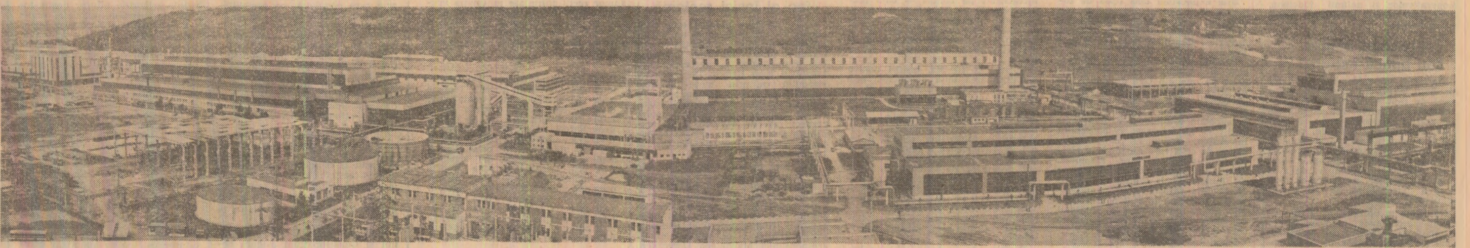
Vedere panoramică a Combinatului de utilaj greu din Iași