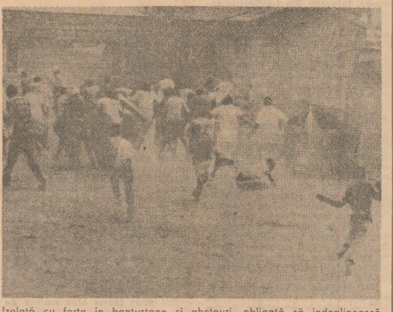
Izolată cu forța în bantustanele și ghetouri, obligată să îndepinească cele mai grele și mai prost plătite munci, înjosită și umilită în propria țară, populația de culoare, majoritară, din R.S.A. își manifestă cu tot mai mare vigoare protestul împotriva politicii de apartheid...