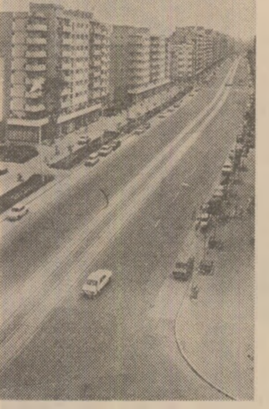
Construcții noi, moderne, pe o veche arteră bucureșteană: Calea Moșilor

— Amintești de sporiul de frumos adus de generațiile tinere... — Da, în ceramică, în cusătură, în țesături, în fabricarea de mobilă. Chiar și promoțiile de tineri care se realizează ca electricieni, mecanici, electroniști în industria extractivă și în cea extractivă de petrol, în noua platformă industrială — cu toții au în suflet frumusețea poeziei acestui loc.