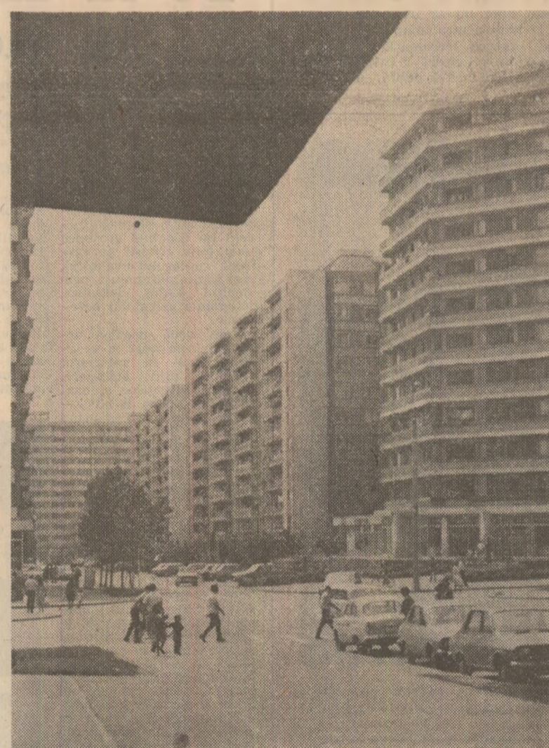
Din noile construcții ale municipiului Galați