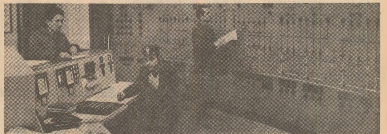
Termocentrala Ișalnita: camera de comandă

pede a paletelor, conducerea centrală a luat recent măsura de a organiza cite patru formații de muncitori pe fiecare schimb, care să se ocupe numai de reparațiile acestor utilaje. Totuși, în perioada mîsurilor lunte, nivelul producției înregistrează fluctuații destul de mari. În consecință, în perioada care a trecut din acest an, planul la producția de energie electrică nu a fost îndeplinit integral. — În adunarea generală a oamenilor muncii am analizat cu exi-