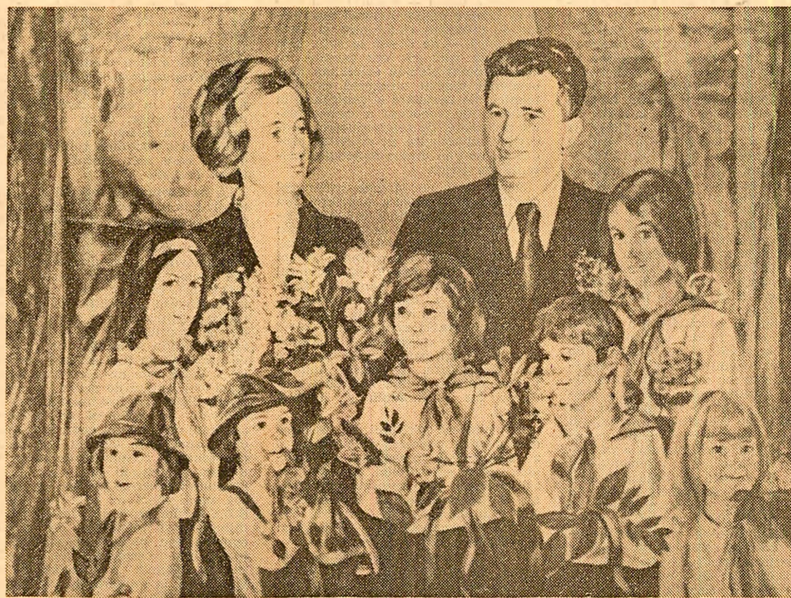
Pictură de Zamfir DUMITRESCU

Învățămîntul românesc asigură astăzi cadrul larg, accesibil, democratic de formare a cadrelor necesare dezvoltării economico-sociale a țării, de ridicare a nivelului general de cultură al întregului popor, de pre-