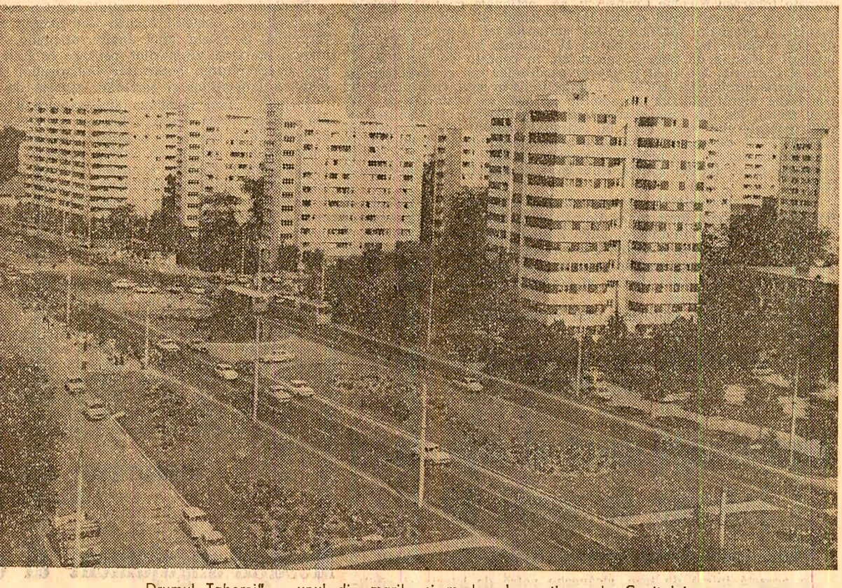
„Drumul Taberei” — unul din marile și modernele cartiere ale Capitalei.

Fii ai pămîntului fiind din străvechimi, E vara pentru noi un anotimp ales: Un sol fertil, zent în înălțimi Și vremea cea mai bună de cules. de ingeur, Avînd pe Nicolae Ceaușescu simbol de început — Asemeni unei aure — și demn și legendar — Unind cu viitorul un glorios trecut. lar vara deveni cel mai bogat cules, În semn că-n toate punem sămînța cu teme, De-atunci de la Acel al Nouălea Congres, Cînd revoluția intra în drepturile ei. Nicolae STOIAN