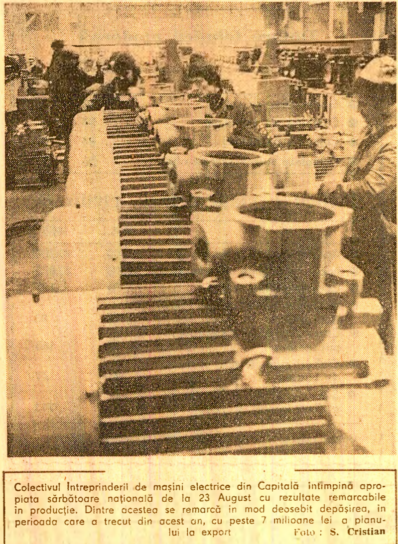
Colectivul întreprinderii de mașini electrice din Capitală...