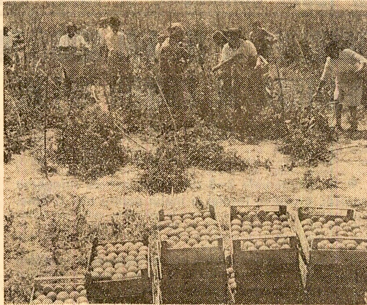
Recoltarea tomatelor la C.A.P. Broniștea, județul Giurgiu

Anchetă realizată de Nicolae BABALAU Octav GRUMEZA Tristram MIHUTA