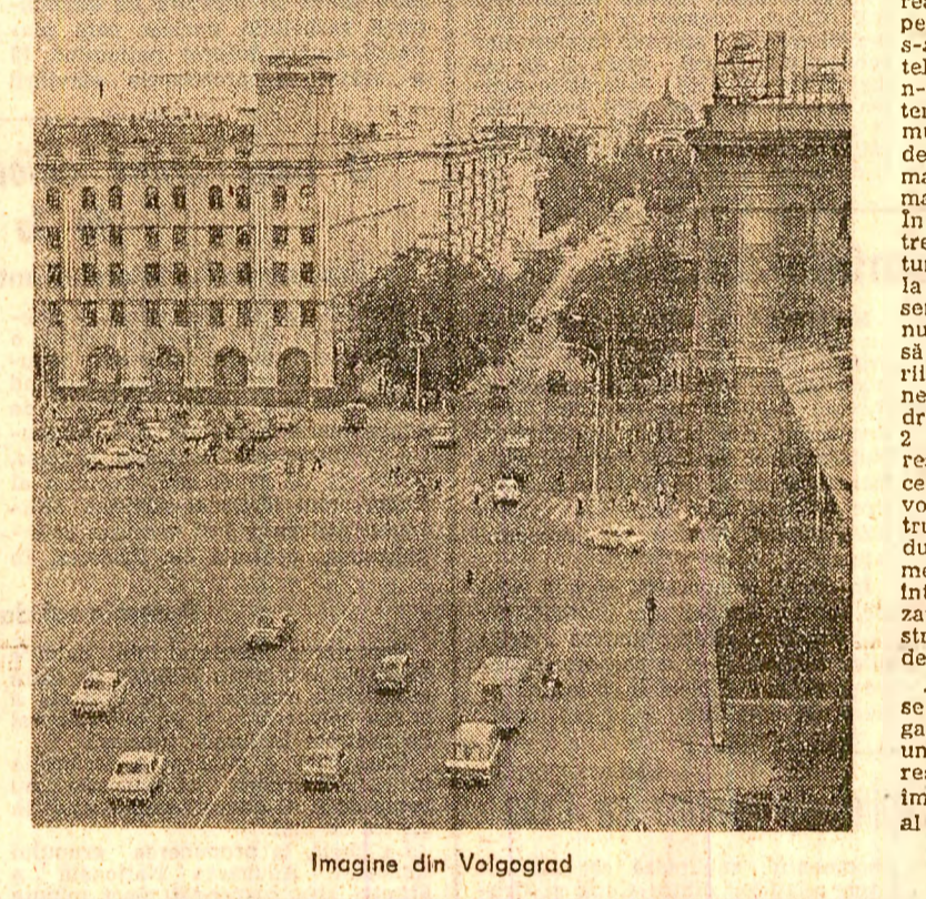
Imagine din Volgograd