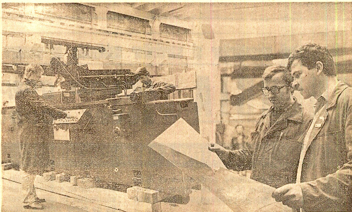
În aceste zile, la întreprinderea de mașini-unelte, accesorii și scule din Baia Mare se muncește intens bine organizat pentru îndeplinirea în cel mai bune condiții a planului la producția fizică.