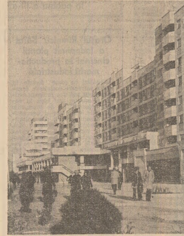
Din noua arhitectură a municipiului Alexandria

Laurențiu DUTA și corespondenții „Scintei”