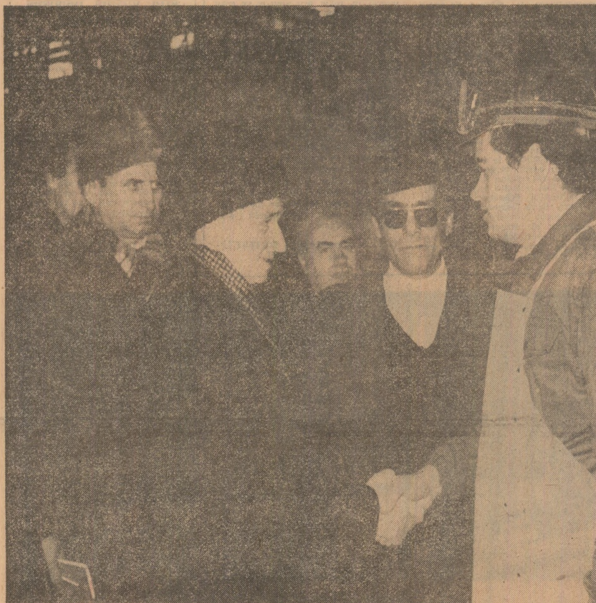
La întreprinderea „23 August”: unul din nenumăratele momente în care oamenii muncii și-au exprimat sentimentele de aleasă stimă și prețuire față de conducătorul partidului și statului

Vizita de lucru a continuat la turnătoarele de oțel și fontă, sectoare cu rol hotărîtor în desfășurarea rit-mică a întregului proces tehnologic. Tovarășul Nicolae Ceaușescu i s-a înfățișat modul în care se acțio-nează pentru transpunerea în viață a indicațiilor pe care le-a dat în pre-cedentele vizite de lucru cu privire la modernizarea, automatizarea și mecanizarea sectoarelor calde, ur-mărindu-se, în final, eliminarea completă a muncii manuale. S-a în-format că specialiștii au definitivat și aplicat o serie de tehnologii mo-derne, de mare productivitate și eficiență economică, care asigură realizarea unor produse de calitate, precum și o înaltă productivitate a muncii. Pe baza programului special elaborat la indicația secretarului general al partidului, în aceste sec-toare urmează să fie puse în func-țiune, pînă la sfârșitul anului viitor, noi linii tehnologice modernizate,