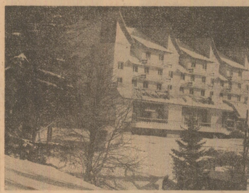
Ilustrată din frumoasa stațiune Durău