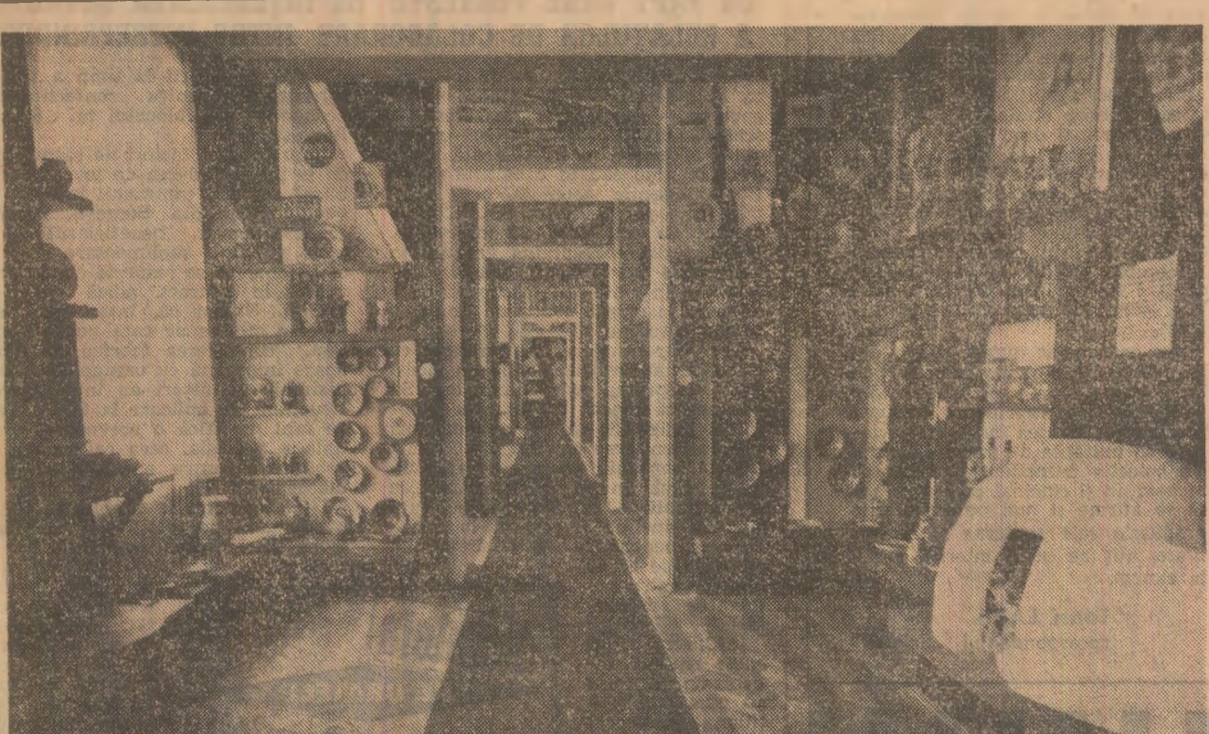
La Muzeul tehnicii și artei bucovinene din Rădăuți