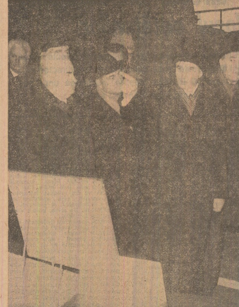
În timpul vizitei la Întreprinderea de confecții și tricotaje și la întreprinderea „23 August”