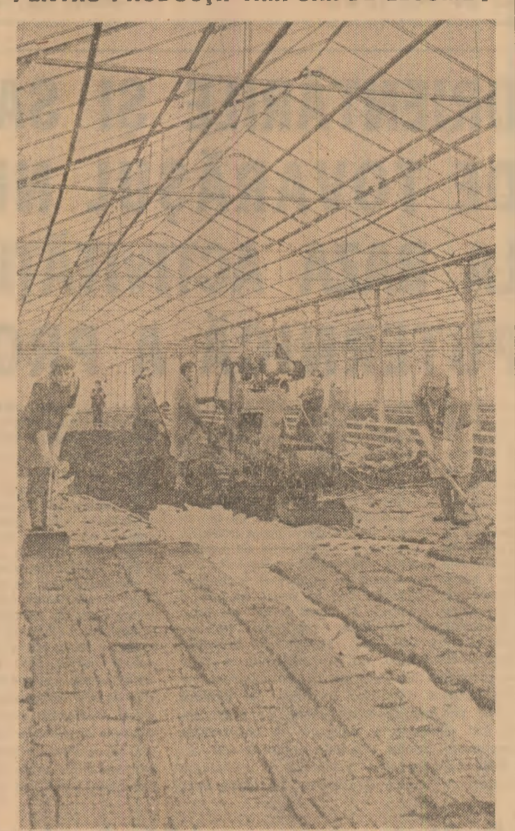
Pregătirea temeinică a solarilor, ca și a producției din câmp pentru a se realiza cantități cât mai mari de legume timpurii, aceasta trebuie să fie preocuparea principală a toată fermele legumicole, pentru toți legumicultorii. (În imagine, pregătirea cuburilor pentru răsăduri la Întreprinderea pentru producerea legumelor Cimpia Turzii, județul Cluj)

de la nivelul județelor în vederea participării efective la desfășurarea lucrărilor din campania agricolă de primăvară, luînd măsuri pentru executarea lucrărilor de cea mai bună calitate și în perioada optimă; ● control permanent în teren, de la amplasare și pînă la în-