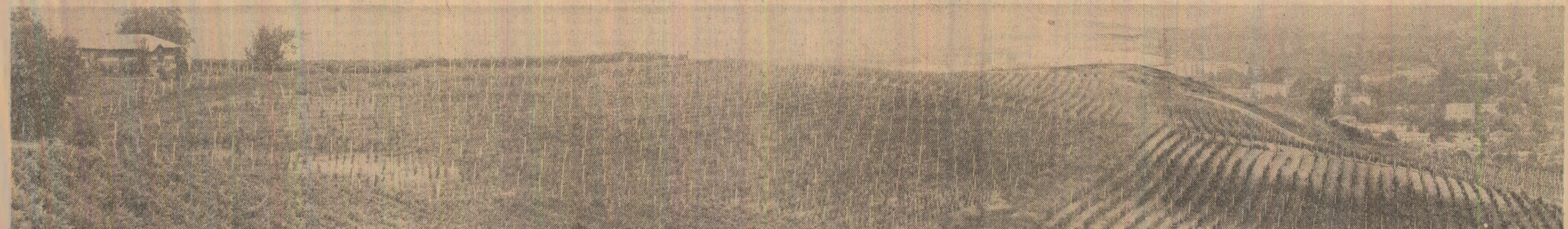
Pagină realizată de Ioan HERȚEG

Organele și organizațiile de partid, consiliile populare și organele de specialitate, concomitent cu popularizarea largă a prevederilor cuprinse în program, au datoria să acționeze energic ca toate lucrările preconizate să se desfășoare la timp și cu răspundere. Este o condiție esențială a modernizării și intensificării viticulturii și pomiculturii, a creșterii producției de struguri și fructe.