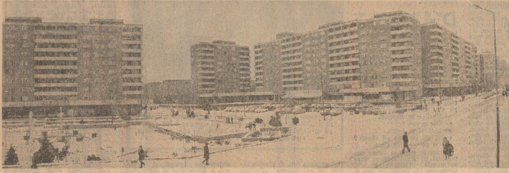
Arhitectură modernă la Oradea

Mircea ANGELESCU (Continuare în pag. a V-a)