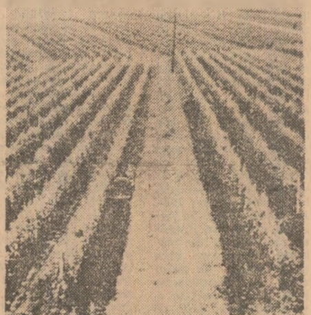
nate de condițiile agroclimatice și expoziția vînturilor.

Ceea ce se preconizează în programul aprobat nu este altceva decît amplasarea viilor și a pomilor în zonele cu trandee în cultivarea lor. Cu vechuri sau chiar cu milenii în urmă oamenii au dezvoltat cultura viței de vie și a pomilor fructiferi cu precădere în anumite perimetre, dovedite prin experiența comună a generațiilor de viticultori și pomicultori, ca cele mai corespunzătoare. De exemplu, observarea modului de comportare a viței de vie în cadrul diferitelor perimetre și examinarea strugurilor și a vinului obținute au stat la baza constituirii diferitelor podgorii din țară. La fel, pomii cultivați în zona de deal, nu numai că dau fructe de calitate superioară, cu gust și aromă plăcute, dar valorifică în mod superior terenuri care, în mod obișnuit, nu pot fi cultivate în mod economic cu cereale sau plante tehnice. Iată de ce cultura viței de vie și a pomilor fructiferi trebuie așezate în perimetrele tradiționale, indicate drept cele mai economice față de alte culturi, perimetre situate în zona dealurilor, care să corespundă, bineînțeles, cerințelor de sî-