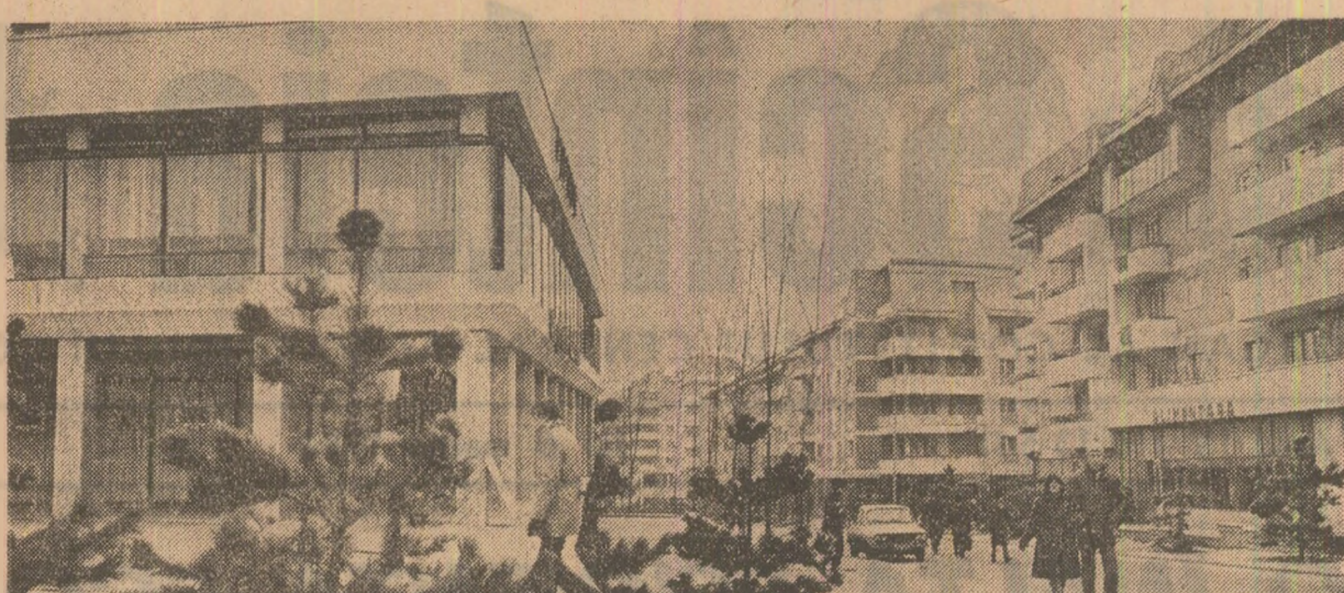
Noi construcții de locuințe, cu spații comerciale la parterul blocurilor, în municipiul Suceavo