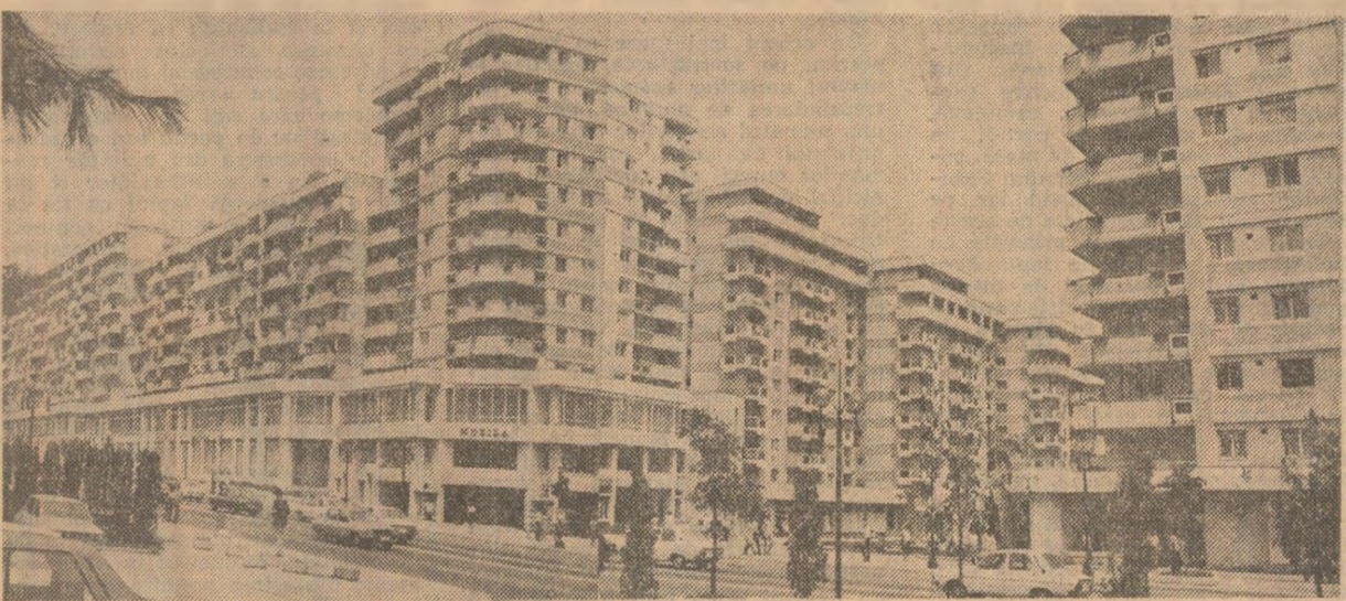
Arhitectură nouă la Pitești