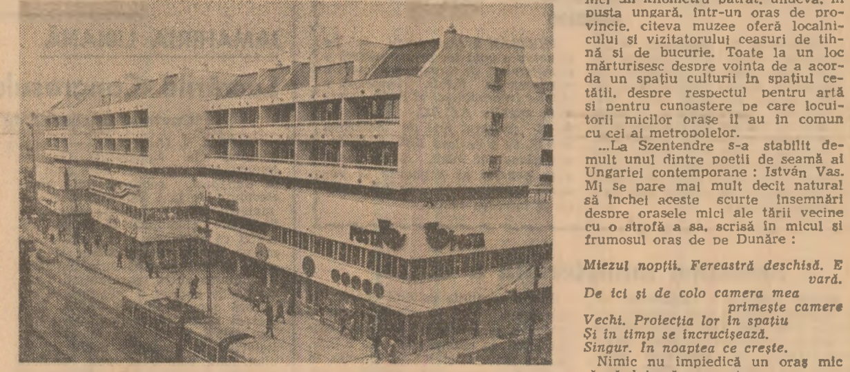
Fotografia de mai sus, transmisă de agenția M.T.I., înfățișează unul din noile cartiere ale orașului Miskolc, din nordul R.P. Ungare

„Estrada Armatei (sala C.A.): Start la varietăți — 18. Studioul de teatru I.A.T.C. (15 72 59): Rosencrantz și Guildenstern — 18,30.