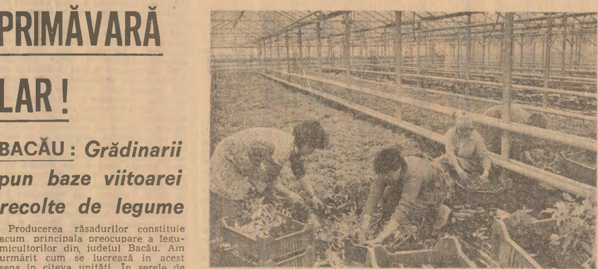
La Întreprinderea de sere Popești, sectorul agricol Ilfov, se pregătesc 5 milioane fire de răsăduri.

În fermele legumicole de la Hemeiui, Făraoni, Traian, Tamași, Prăești, Leta Veche, grădinarii repară solariile, amenajează răsădnite, transportă amestecuri de pămînt și biocompostibil necesar. Se prevede ca pe cele 20 ha de solarii și în răsădnite să se realizeze circa 100 milioane de răsăduri de legume. Totodată, vor fi produse mari cantități de răsăduri pentru gospodăriile populației. Pînă la această dată au fost reparate răsădnite în suprafață de peste 60.000 mp din cele 70.000 mp existente. În fermele legumicole de la Gîrleni și Bișghir, unde s-au