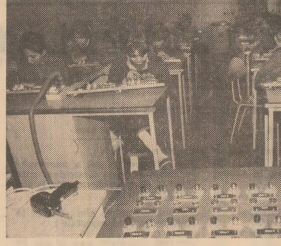
In atelierul de electronică al Liceului „I. L. Caragiale” din București