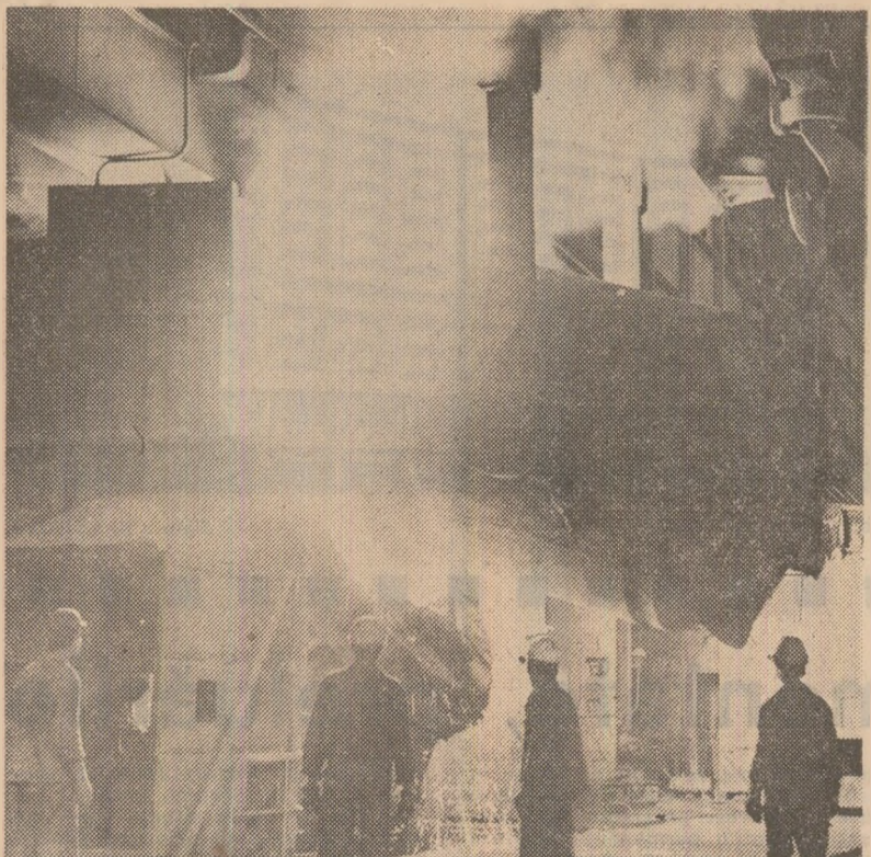
Hornicii siderurgiei gălățeni acționează în aceste zile cu toate forțele pentru a încheia primul trimestru al anului cu rezultate cit mai bune în producție.